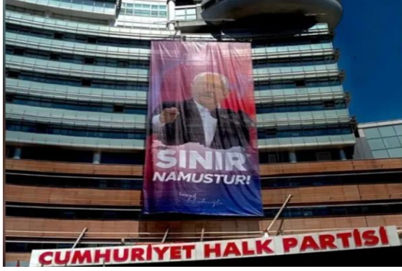
Şekil 1: CHP'den sınır namustur pankartı