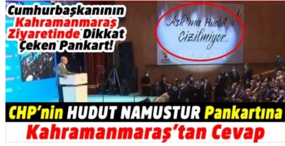
Şekil 5. AK Parti'den aşkına hudut çizilmiyor pankartı