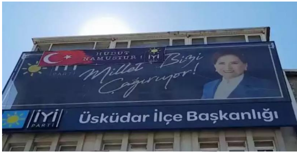
Şekil 3. İYİ Parti’den hudut namustur pankartı