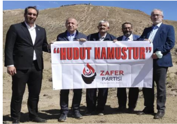
Şekil 4. Zafer Partisi’nden hudut namustur pankartı