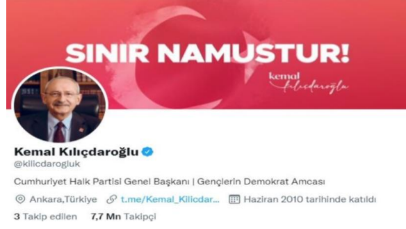
Şekil 2: Kemal Kılıçdaroğlu'nun sosyal medya profili