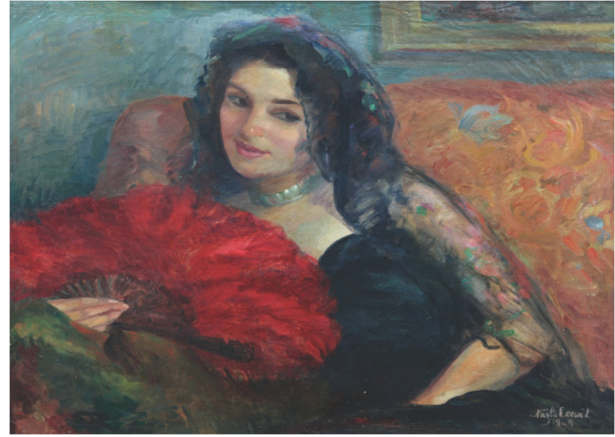
Resim 9 F. Nazlı Ecevit (1900-1985), "Yelpazeli Kadın" (1949) Tuval üzerine yağlıboya 65x81 cm.

Sanat alanındaki diyalektik gelişiminin ortaya çıkardığı yeni birlik anlayışı artık yalnızca etkinlik gösterme anlayışından çok farklı bir üslup çerçevesinde toplanma biçiminde olacak şekilde gelişmiştir. Çallı ve kuşağının başlattığı yeni ve farklı sanat birliği oluşturma fikri, yukarıda da belirttiğimiz üzere, Hikmet Onat ve İbrahim Çallı atelyelerinden mezun olan Şeref Akdik, Saim Özeren, Refik Epikman, Elif Naci, Cevat Dereli, Mahmut Cûda, Muhittin Sebati, Ali Avni Çelebi ve Zeki Kocamemi'nin kurduğu Yeni Resim Cemiyeti ile devamlılık kazanmıştır (Berk, 1974: 43).