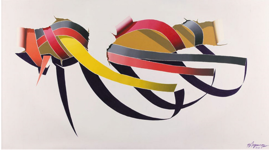
Resim 19 Burhan Doğançay (1929-2013), "Kompozisyon" (1989) Özel koleksiyon