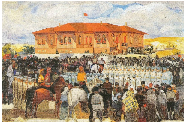
Resim 11 Refik Epikman (1902-1974), "İlk Meclis" Tuval üzerine yağlıboya 100x141 cm. ADRHM

Adı 1921 yılında Osmanlı Ressamlar Cemiyeti'nden Türk Ressamlar Birliği'ne sonra 1926'da Sanayî-i Nefise Birliği 'ne, bir sonraki yıl da Güzel Sanatlar Birliği 'ne çevrilen eski gelenekçi birlik, artık 1928-1929'da iyice etkisizleşmiştir. Bu dönemde Cumhuriyet'in ilk kuşağını temsil eden ve yeni devletin kuruluşuna temel olan düşüncelerden hayat bulan bir birlik kurma fikri doğmuştur. Böylelikle, Avrupa'dan yeni dönen Refik Epikman, Cevat Dereli, Zeki Kocamemi, Kamil Akdik, Mahmut Cûda, Nurullah Berk, Hale Asaf, Ali Avni Çelebi, Muhittin Sebati ve Ratip Aşir Acıdoğu gibi sanatçılar 1929'da bu arzulara cevap vereceğini umdukları Müstakil