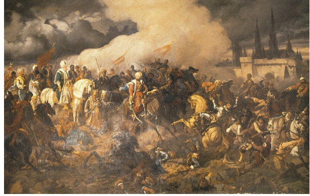
Resim 3 Hasan Rıza (1859-1913), "Birinci Viyana Kuşatması, 1529" Tuval üzerine yağlıboya 188x312 cm. Harbiye Askeri Müzesi