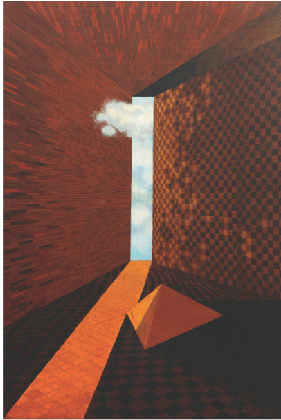
Resim 18 Erol Akyavaş (1932-1999), "Kompozisyon" Tuval üzerine akrilik 220x146 cm.

1936 yılında yapılan ' Güzel Sanatlar Akademisi Reformu ' sırasında Resim Bölümü Başkanlığına atanan Fransız ressam Leopold Levy (1882-1966) ile başlayan yeni eğitim süreci, 1940 yılından sonra resim sanatında yeni bir dönemin başlamasında etkili olmuş, Nuri İyem (1915-2005), Ferruh Başağa (1914-2010), Turgut Atalay (1918-2004), Selim Turan (1916-1994), Agop Arad (1914-1990), Avni Arbaş (1919-2003), Mümtaz Yener (1918-2007),