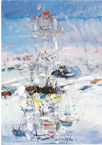
Resim 20 Alaybey Karoğlu (1961), "Bir Yanlılık Öyküsü" (2010) Tuval üzerine yağlıboya 70x100 cm. Özel Koleksiyon

1950'li yılların ortalarından itibaren Türk 'pentür'ü grup karmaşası içindeki tek sesliliği terk ederek, evrensel / milli, evrensel / yerel, toplumcu / bireyci (sosyal / individualist) veya soyut / figüratif vb. gibi birçok eğilimi bir arada yansıtan çok soluklu, çoğulcu bir yapıyı tercih etmiştir. Ancak bu çoğulcu yapı, içinde alan içi bilgi ve kültürel tabana dayalı iki güçlü eğilim tüm yönelimleri kavrayan bir özelliğe sahip olmuştur. Bunlar, Cumhuriyet'le birlikte yeni bir içeriğe ve kavram sözlüğüne kavuşan 'millilik' ve 'gelenek' ile giderek bireye yönelen 'hümanizma' anlayışlarıdır. Gerçi, siyasal olguların hareket kazandığı, kimi dönemlerde birbirleriyle bir çatışma içine girmişlerse de günümüze uzanan süreçte varlıklarını ve etkinliklerini sürdürmüşlerdir. Yukarıda da belirtildiği gibi 1950'li yıllarla başlayan süreç içinde artık grup hareketlerinin önemli bir yeri olduğu söylenemez.