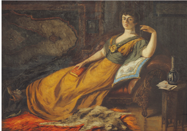
Resim 4 Şehzade Abdülmecit (1868-1944), "Haremde Götethe" Tuval üzerine yağlıboya 132x173 cm. ADRHM

'Avrupalı' ya tepeden bakmayı bırakıp, yüzünü Avrupa'ya dönmesiyle, hedefi tüm toplum katlarına ulaşmak olan 'Türk Modernleşmesi' denilen süreç başlamıştır. Ancak, 18. yüzyıldan bu yana işleyen zaman içinde, Osmanlı-Türk toplumu, değişen, gelişen tarihi, sosyal ve siyasal vaka ve olaylara rağmen, tarihi diyalektik bir 'kültürlenme süreci' hareketliliğine sahip olmadığı için, kültür ve sanat dünyasını kendine örnek aldığı 'batılı' ölçüsünde geliştirememiştir. Hatta doğu-batı kavramlarının ve buna bağlı olarak zihniyetlerin de karşılaşması ve belki de çatışması olarak adlandırılabilir bu sürecin başlangıcında geleneksel sistem ve aidiyetlerine sıkı sıkıya bağlı son dönem Osmanlı kültür, sanat ve düşünce dünyası, yabancı felsefe ve değerler sistemi ile karşı karşıya kalarak özgün manifestosu olan yaratıcı dinamiklerini ortaya koyamamıştır.