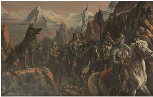
Resim 13 Ratip Tahir Burak (1904-1977), "Ergenekon I" (1935) Tuval üzerine yağlıboya 152x227 cm. ADRHM