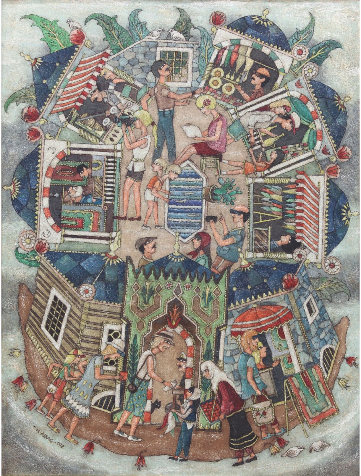
Resim 17 Nuri Abaç (1926-2009), Kervansaray II" (1992) Tuval üzerine yağlıboya 80x105 cm. ADRHM