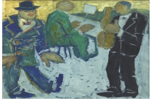
Resim 12 Fikret Mualla (1903-1967), "Orkestra ve Dans Eden Adam" (1955) Karton üzerine guvaj boya 49.5x61 ADRHM

Birlik üyeleri, değerler karmaşası ve çekişmelerinin kırıncı ve bölücü ortamından kaçınarak ortak etkinlikleri amaçlamışlardır.