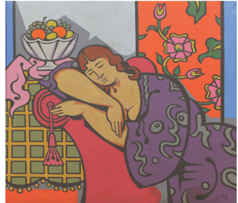
Resim 14 Nurullah Berk (1906-1982), "Portre" Tuval üzerine akrilik 10x10 cm. ADRHM