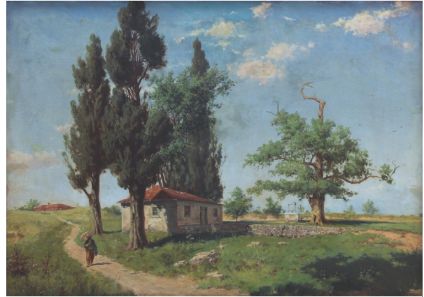
Resim 2 Hoca Ali Rıza (1858-1930), Manzara Tuval üzerine yağlıboya 93x130 cm. ADRHM