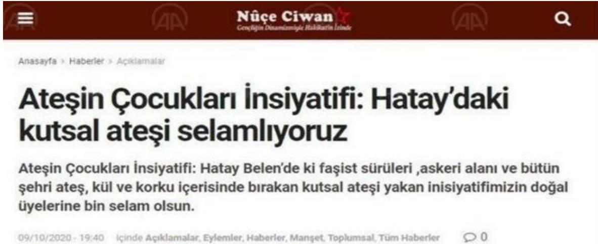
Şekil 4 AÇİ'nin Hatay'daki Yangınları Üstlendiği Mesajı (Pancar, 2020)

Ekim 2020'de Hatay'ın birçok noktasında çıkan orman yangınlarını üstlenen AÇİ, aynı sene içerisinde İstanbul, Adana, Antalya, Bursa, Muğla, Manisa, Bilecik, İzmir, Denizli, Kocaeli gibi şehirlerde; elektrik şebekelerine, askeri ve sivil araçlara, park/bahçelere, ahırlara ve gıda depolarına çevresel terör eylemlerinde bulunmuştur (Yılmaz, 2020). AÇİ, 2021 Temmuz'unda başlayan büyük orman yangınlarının faillerinden biri olmakla birlikte aynı yılın devamında 1.056 yerde 1.778 sabotaj/kundaklama eylemi gerçekleştirmiştir. Buna göre 600 dönüm zeytinlik, 5.500 dönüm buğday tarlası, 8.000 dekar turistik alan/orman/sazlık, bir senede yakılmıştır (Oda TV, 2021; Yeni Şafak, 2021).