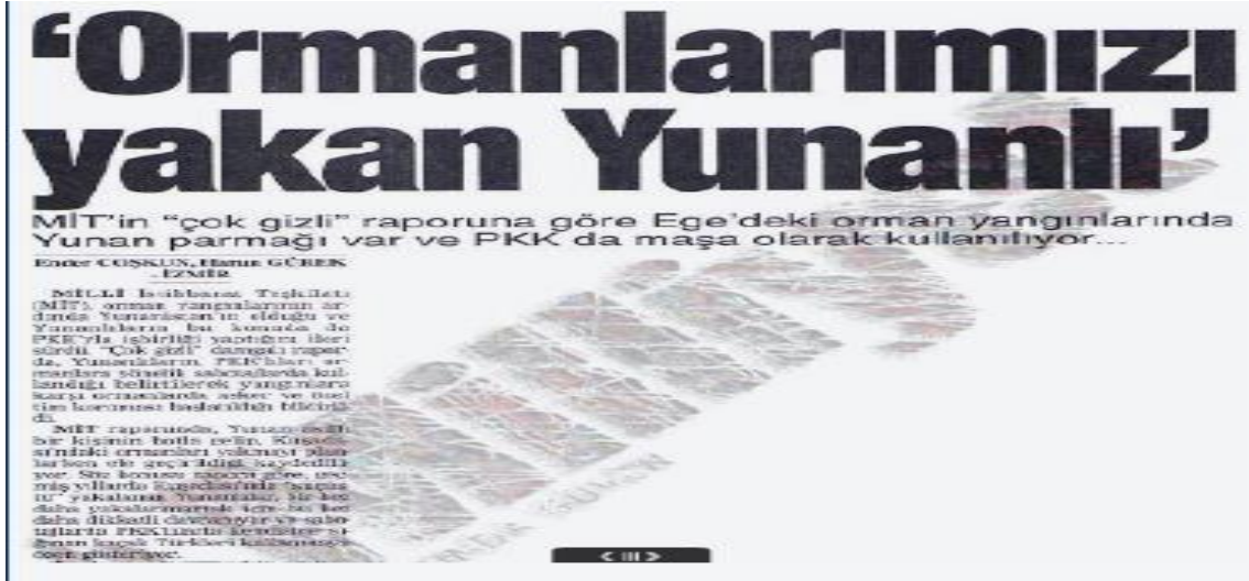
Şekil 1 Orman Yangınlarında PKK-Yunanistan İlişkisi (Milliyet, 1995 Akt. Güngörmez ve Alkanat, 2019)

durumu doğrulamıştır (Güngörmez ve Alkanat, 2019: 13). Türkiye'nin turizm ekonomisine zarar vermek, turistlerin kendi ülkelerine gelmesini sağlamak ve Türkiye'de korku atmosferi yaratmak amacıyla Yunanistan, birçok kamp (Lavrion, Nikolas, Dimitri Elen, Xanthi, Kinesa, Dileysi Kampları) tesis ettiği PKK'ya eğitim desteği sunmuş ve Türkiye'de çevresel terör eylemlerinde kullanmıştır (Bayraklı, Yalçın, Yeşiltaş, 2019).