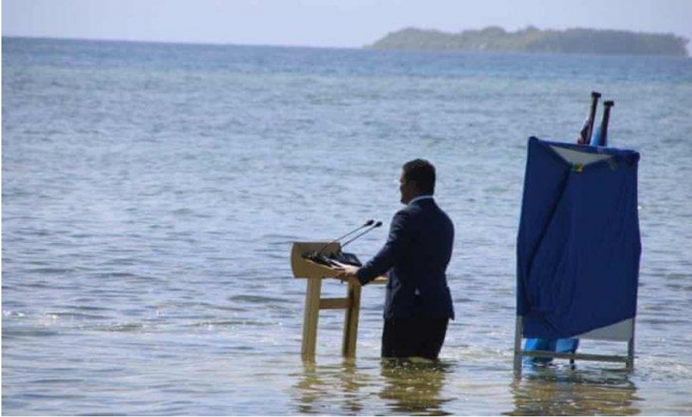
Şekil 1: Tuvalu Dışişleri Bakanı Simon Kofe'nin Glasgow İklim Konferansına hitabı (2021)

bağlanarak yaptığı açıklamada, Tuvalu olarak iklim krizini tam olarak yaşadıklarını suların içinde yer alan bir tahta kürsüden söylemiştir (Şekil 1). Bu sebeple okyanuslar etrafımızda yükselirken, iklim kriziyle mücadele için eylem ön plana çıkması gerektiğini belirtmiştir. Uzun zamandan beridir iklim krizinin etkisinin gözle görülmesi açısından bir tür laboratuvar olarak kullanılan Tuvalu, tarihte deniz seviyesinin yükselmesiyle yok olması en muhtemel ilk ülke olarak yer almaktadır. Bu sebeple de barındırdığı 12 binlik nüfusla iklim dolayısıyla göçe zorlanacak en erken dönem iklim mültecileri içerisinde yer almaktadır. Ancak bu durum Tuvalulular açısından ve özellikle de boğulmak zorunda kalacakları bir dünya açısından hiçte iç açıcı olmadığı gibi, bu duruma karşı da tepki göstermektedirler. Çünkü onlar yaşadıkları durum dolayısıyla kendilerinin tam insan hissedememekten rahatsız olmaktadır (Crawford, 2022; Handley, 2021; Joly, 2021).