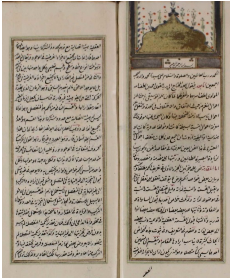
Beyazıt Yazma Eserler Kütüphanesi, Veliyyüddin Efendi, nr.2329/2, vr. 69b-70a (Risâle-i Mûsikî'nin ilk sayfası)