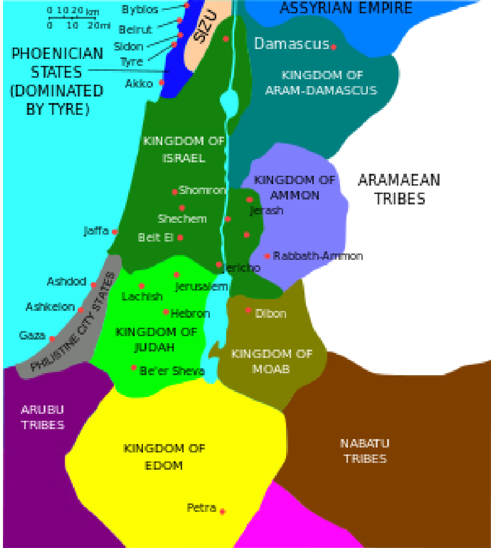
EK 1 : HARİTA (MÖ 830'larda Filistin Haritası. Bkz: http://tr.wikipedia.org/w/index.php?title=Dosya:Levant_830 )

☉ Yehuda Krallığı ☉ İsrail Krallığı ☉ Filist şehir devletleri ☉ Fenike devletleri ☉ Ammon Krallığı ☉ Edom Krallığı ☉ Aram-Şam Krallığı ☉ Aramî kabileleri ☉ Arubî kabileleri ☉ Nabatî kabileler ☉ Asur İmparatorluğu ☉ Moav Krallığı