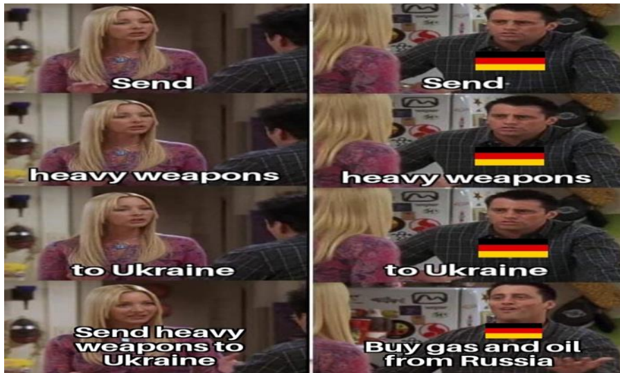
Görsel 6. Friends Dizisi