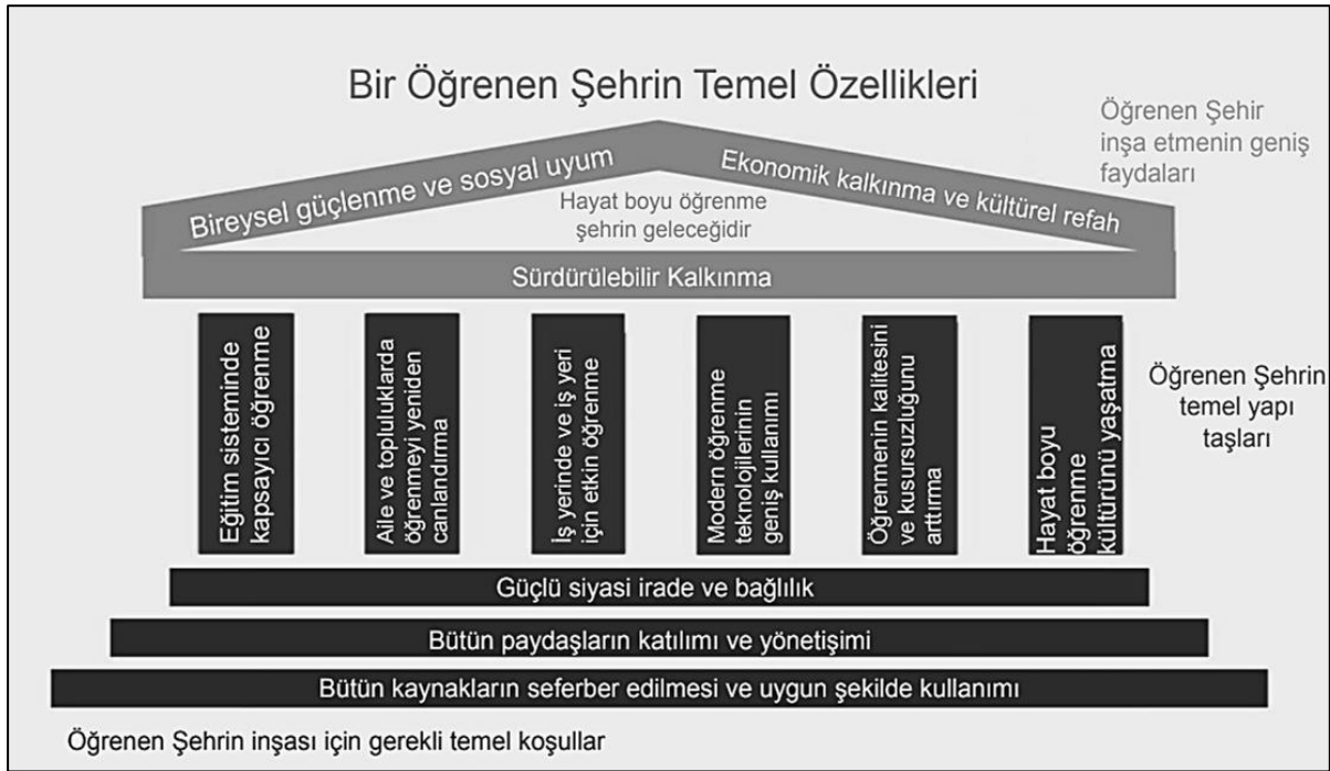
Şekil 1. Öğrenen Şehrin Temel Özellikleri