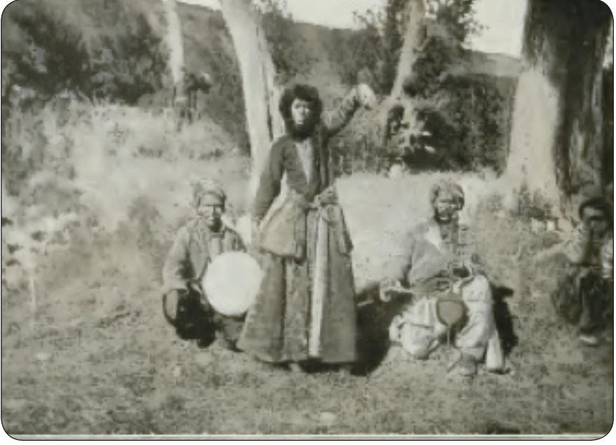
Şekil.1. Kopal'da Dans Eden Kürt Genci (Sayfa 254'ten Şekil.179)