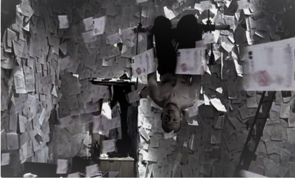
Resim 1. Filmin Başındaki Kronotopik Mekân

Filmin başlangıcını oluşturmakta olan bu sahnede Emrah üzerlerinde mühür bulunan ve devlet evrağı olduğu anlaşılan kâğıtlarla dolu kronotopik bir odada bir salıncakta ters bir biçimde sallanırken görülmektedir. Devamında bu kâğıtlar Emrah'ın bedeni üzerinde çeşitli kesikler oluşturmaktadır. Bu tür bir mekânın üretilmesi ve kâğıtların insan yaşamını tehlikeye atıcı şekilde betimlenmesi aslında bürokrasinin kapalı ve bireyi sınırlandırıcı mahiyetinin teşekkülünü göstermektedir. Bir başka deyişle bürokrasi yapılarının bireylerin sosyal ufkunu sınırlayan boğucu bir mekân olarak anlatılmasında güçlü bir klostrofobi ve hareketsizlik duygusu içerdiği anlaşılmaktadır.