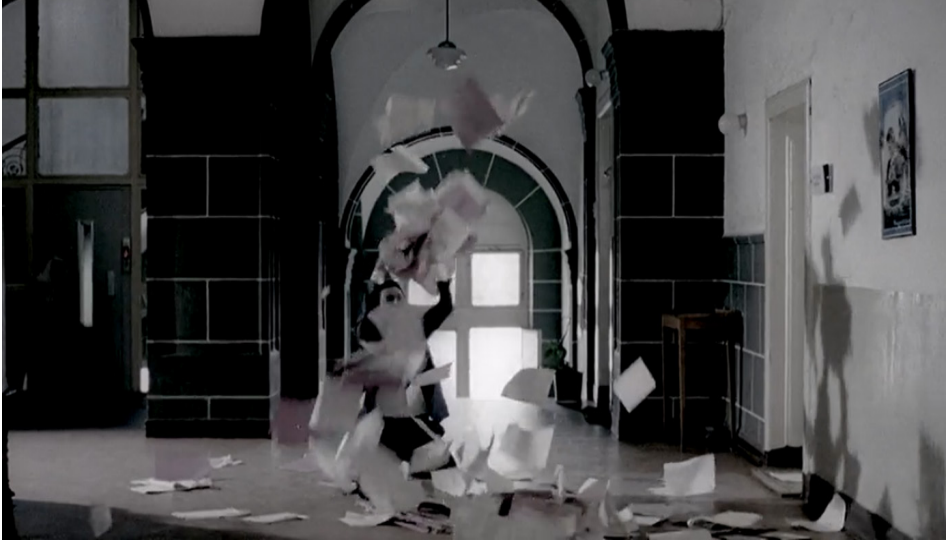
Şekil 3. Senaryoyu Onaylatmak İçin Gidilen Devlet Kurumu