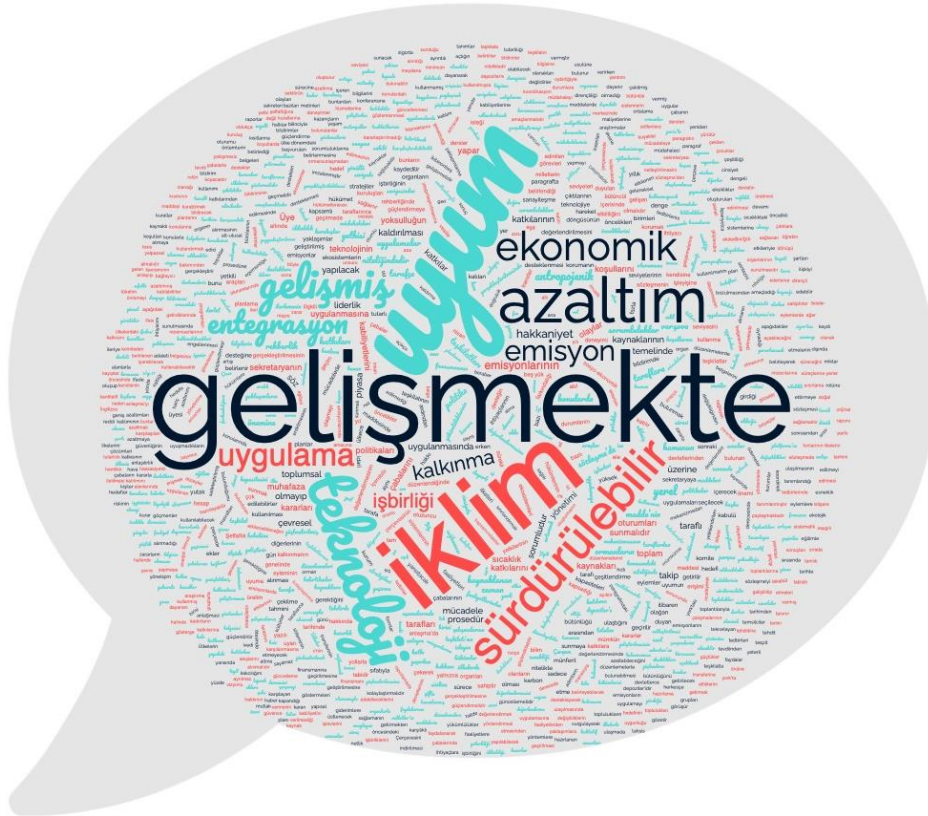
Şekil.1: Paris Anlaşması’nda Öne Çıkan Kelimelerden Oluşan Bulut

Küresel iklim rejiminin oluşması için daha önceden atılmış olan adımların en çok eleştiri aldığı noktalardan bir tanesi, gelişmiş ve gelişmekte olan ülkeler arasındaki sanayileşme farkının göz ardı edilerek tüm taraflar için aynı kısıtlama ve azaltma adımlarının öngörülmesi olmuştur. Diğer bir deyişle, Sanayi devriminden itibaren, sanayileşmesini tamamlamış olan gelişmiş ülkelerle sanayileşme süreçleri devam eden gelişmekte olan ülkelerin oluşturulan iklim rejimi bağlamında emisyon azaltmaya yönelik çabalarında aynı kısıtlayıcı kurallara tabi tutulmaları eleştirilmiştir. Sera gazı salınımlarında etkisi olmasa da en savunmasız olan ülkelerin iklim değişikliği ile mücadelede iklim değişikliğini hafifletme ve uyum sağlamada karşılaşacakları maliyetleri nasıl yüklenecekleri ya da ne kadarını yüklenmelerinin adil olacağı sorgulanmaktadır. İklim adaleti tam da bu noktada gelişmekte olan ülkelerin kendilerinin büyük ölçüde sebep