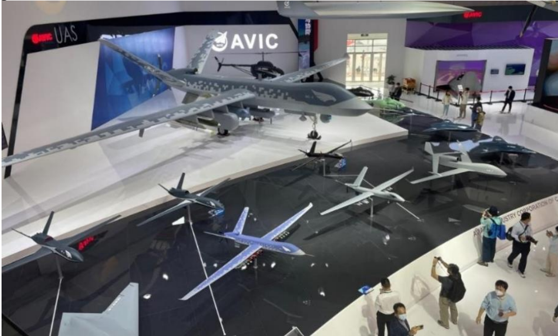
Şekil 2: Airshow China 2022'den alınmış bir görsel, üst kısımda Wing Loong 3 İHA'sı görünmektedir

HKO'nun insansız hava araçlarına dair teknolojik geçmişi ÇHC'nin kuruluşu ile yakın tarihlere, 1950'lere kadar uzanmaktadır. Çin insansız hava araçları serüveninin başlangıç noktasında Sovyetlerden ithal edilen bir grup La-17 hedef drone sisteminin alınması yer almaktadır. Ancak sonrasında çeşitli politik sebeplerin gölgesinde soğuyan Çin-Sovyet ilişkilerinin ardından Sovyetlerin askeri desteğinin geri çekilmesi Çin'i kendi hedef dron sistemini geliştirmeye yöneltmiştir. CK-1 (Chang Kong- 1) isimli bu sistem, Sovyet La-17'nin taklit ürünü niteliğinde bir hedef drone sistemi olarak öne çıkmıştır. 1960'larda ABD'ye ait AQM-34 Firebee insansız hava aracının Vietnam'da vurularak düşürülmesi sonrasında HKO bir başka önemli insansız hava aracını edinmiştir. Bu sayede AQM- 34, 1980'lerde tersine mühendislik ile WZ-5'in (Wu Zhen-5) üretilmesine ışık tutan önemli bir araç olmuştur (Hwang, 2020, s. 128).