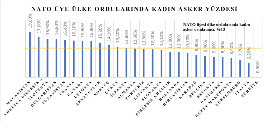
Grafik 1. NATO Üye Ülkelerde Kadın Asker Oranı (NATO, 2020).