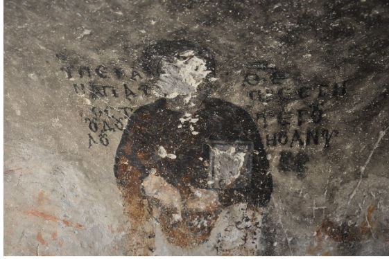
Resim 6. Alçak (Alaca) Kaya Altı Kilisesi, Giriş Mekanı Doğu Duvar Mezar Yazıtı (Şahna arşivi, 2015)