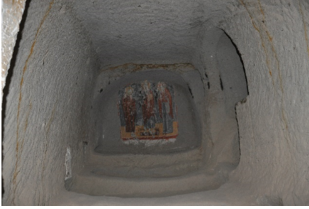
Resim 2. Ihlara, Yılanlı Kilise, Mezar odası kuzeye bakış

Bizans mimarisinde hemen hemen birbirine yakın yüzyıllarda farklı bir plan tipinin de mezar ya da anma kiliselerinde tercih edildiğini görürüz. Kappadokia'da hem kagir hem de kayaya oyma kiliselerde örneklerine rastladığımız bu yapı tipi iki nefli plandır. Mezar kilisesi olarak da tanımlanan bu yapı tipinde kuzey nefin defin ya da mezar alanı olduğu güney nefin ise apsis ile sonlanmasından dolayı asıl nef olduğu ifade edilse de günümüze ulaşan örneklerin tamamının bu düzenlemede olmadığı görülür. İki nefli kiliselerin erken örneklerini kagir yapılar oluşturur. †† Kilise 18 olarak isimlendirdiğimiz iki nefli mezar kilisesinin içinde mezar yoktur, ancak girişinde arkosolium tipinde ve özellikle kilisenin çevresinde, zemine oyulmuş çok sayıda mezar bulunmaktadır. Ihlara'daki Ballı Kilise'nin kuzey nefi mezar, güney nefi ise ayin için kullanılmıştır. Ayrıca güney nef naosunun zemininde de mezarlar yer almaktadır, ancak bu mezarların ne zaman oyulduğu bilinmemektedir. Ballı Kilise'nin oyulduğu kaya kütesinin dışında da çok sayıda mezar tespit edilmiştir. Eski (Kara) Baca Kilisesi'nin naos güney duvarında arkosolium tipinde mezarlar bulunurken, güneyinde mezar şapeli, şapelin