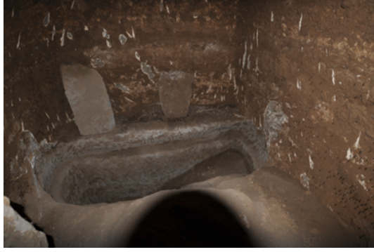
Resim 7. Kilise 17, mezar odası