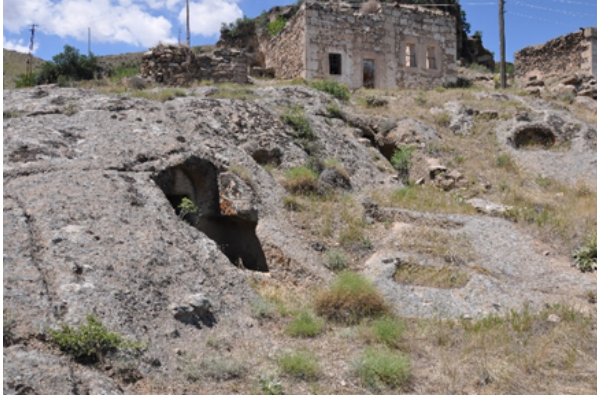
Resim 4. Ihlara, Ballı Kilise, Güney Neften Kuzeye Bakış