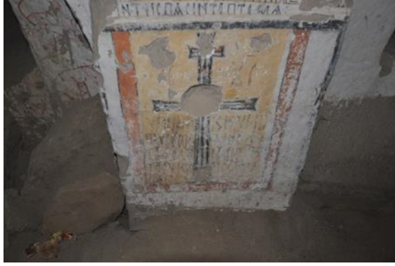
Resim 9. Karagedik c Kilisesi, Kemer iç Yüzeyi, Alt Seviyedeki Yazıt

“Tanrının hizmetkarının ebedi istirahati için, Konstantinos, O Temmuz ayında uykuya daldı (...) (...) yazılıdır (Şahna ve Soykan, 2018: 105-118).