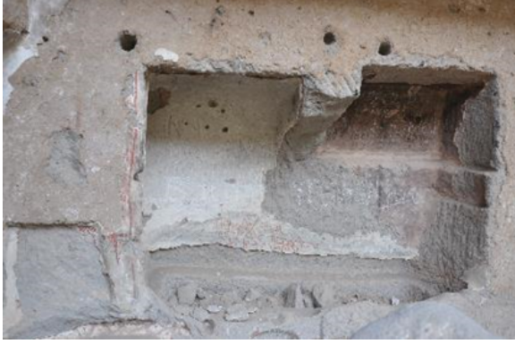
Resim 10. Eğritaş Kilisesi, M1 Mekanı, Doğu Duvar Arkosoliumu ve Yazıtı (Şahna arşivi, 2016)

“Theotokos’un kilisesinin rahibi, keşiş Petrus’un mezarı”