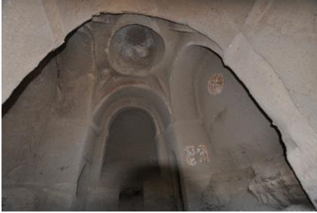
Resim 1. Belısırma, Kilise 4, Apsise Bakış

ancak Kilise 4'ün kuzey ve güney haç kollarında arkosolium tipinde iki mezarın bulunduğunu düşünmekteyiz. Yılanlı Kilise'nin portikosunun batı duvarında bir arkosolium tipi mezar net bir şekilde görülebilirken ayrıca narteksin kuzey duvarındaki kapı ile ulaşılan kuzey güney doğrultusunda dikdörtgen planlı bir mezar odası bulunmaktadır. Kilise 16'nın giriş bölümünde bir zemin mezarı kolaylıkla seçilebilmektedir ancak kilise içinde ve haç kollarında bir mezarın varlığına dair herhangi bir veri tarafımızdan tespit edilememiştir. Benzer şekilde Sümbüllü, Ağaçaltı ve Küçük Ala Kilise'de mevcut durumda mezarlar tespit edilememektedir. Ancak bu yapılarda da arkosolium, zemin mezarı ya da mezar odası şeklinde mezarların olması olasıdır. Ayrıca vadide tespit ettiğimiz kayaya oyma bir yapı kompleksi olan KOM 5'in alt katındaki haç planlı Mekan 5'in gömü işlevli olarak kullanıldığı kanaatindeyiz. Yapılacak temizlik çalışmaları ile bu mezarlar açığa çıkarılabilecektir.**