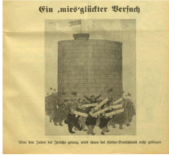
Görsel 10: Onuncu Karikatür

Çalışmada incelenen onuncu karikatür, 21 Mayıs 1933 tarihine aittir. 28 Karikatür, “Kötü bir ziyaret” başlığını taşımaktadır. Karikatürün altında ise “Yahudiler Eriha’da başardıklarını Hitler Almanyası’nda başaramayacaklar” yazısı bulunmaktadır.