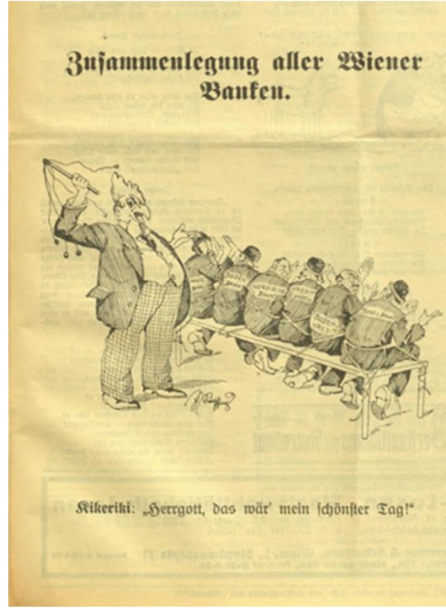
Görsel 1: Birinci Karikatür

Anlatımsallık işlevinde karikatürde Kikeriki'nin temsili olan başı horoz şeklinde, takım elbise içerisinde, elinde kırbaç olan bir temsil resmedilmektedir. Kikeriki'nin temsili elindeki kırbaç, önünde bir sıraya dizili şekilde oturan ve birbirine bağlı olan altı kişiye yönlendirmektedir. Bu kişilerin sırt kısımlarında sırasıyla “Amstel Bank, Boden Bank, Nordische Bank, Kredit Anstalt, Boden Kredit ve Bosel Bank” yazmaktadır. Karikatürde bu altı kişinin dördünün giydiği şapka ve saçlarındaki lüleler, bu kişilerin Yahudi olduğu mesajını vermektedir.