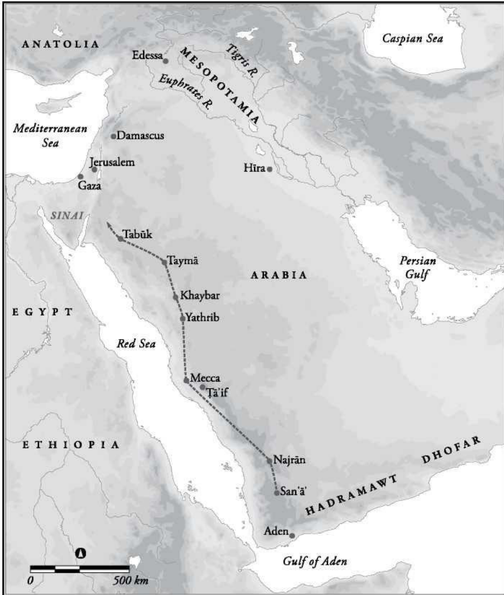
Harita 3: Batı Arabistan Sahil Yolu'nu gösteren görsel [79]

Uzakdoğu, Hindistan ve Hint Okyanusu dünyasını Akdeniz'le birleştiren Batı Arabistan Sahil Yolu , Yemen'den başlayarak Hicaz'a, oradan da Bizans topraklarına ulaşan bir kara yolu. [76] Milâdî 6. asrın başlarında meydana gelen hâdiseler, söz konusu yolun diğer rotalara göre ciddi avantaj kazanmasını sağlamıştır. Nitekim Bizans-Arap ilişkileri konusundaki çalışmalarıyla tanınan İrfan Şehid, çok açık olarak milâdî 6. asırda Arabistan'dan geçen kara yolunun (via odorifera), Bizans ekonomi tarihi açısından o dönemdeki en önemli yol olduğunu ifade etmektedir. [77] Güneyde Arabia Felix 'ten kuzeyde Palaestina Tertia 'ya kadar uzanan bu kara yolu (Buhur/Tütsü Yolu); ters suları ve mercan kayalıkları ile gemicileri zora sokan deniz yoluna göre kesin bir avantaja sahipti. [78]