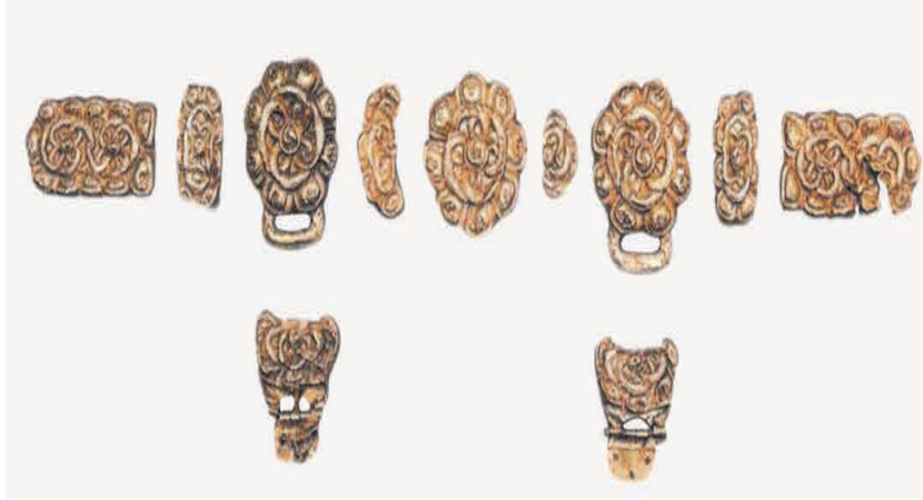
Görsel 10. Set of gold belts. First half of the 13th century. A Chinese-style belt with two buckles 40 .