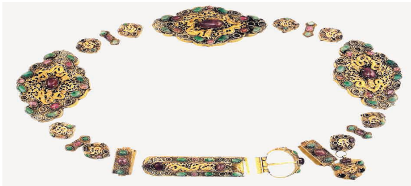
Görsel 4. A set of gold belts adorned with Yakut and jade stones. The belt is meticulously crafted, using precious materials, and is truly at a khanate level 34 .