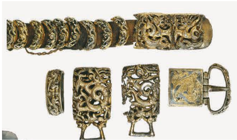
Görsel 12. A Mongol belt adorned with gold-plated silver ornaments 42 .