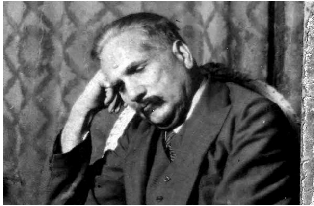
Allame Muhammed İktbal, https://www.worldbulletin.net/muhammed-ikbal.jpg E.T. (26.09.2023)