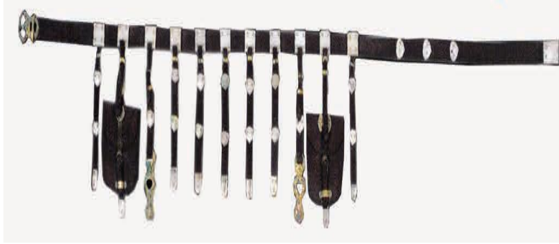
Görsel 2. A set of belts made of jade and gilded bronze. From the tomb of Princess Chen and her husband Xiao Shaoyu in the early 11th century, Institute of Monuments 32 .