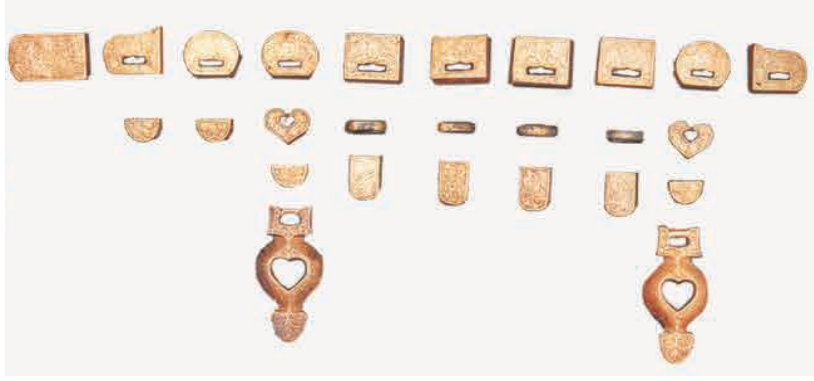
Görsel 1. A set of belts made of silver and gilded bronze. From a tomb in the Bayrağı region, Chelimu County, Inner Mongolia, People's Republic of China 31 .