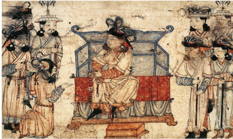
Görsel 3. A miniature depicting ceremonial and award belts for Mongol men. From the early 14th century in Tabriz. Prussian Cultural Heritage, Berlin 33 .