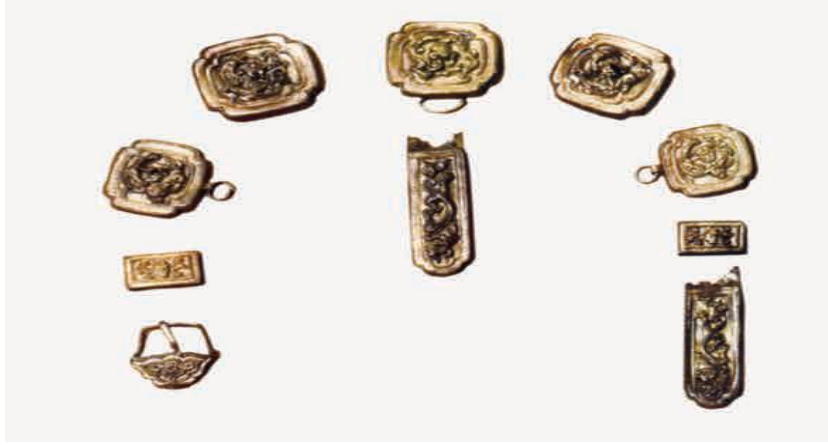
Görsel 5. A bronze child's belt set from the 13th century Yuan Dynasty period. Moscow 35 .