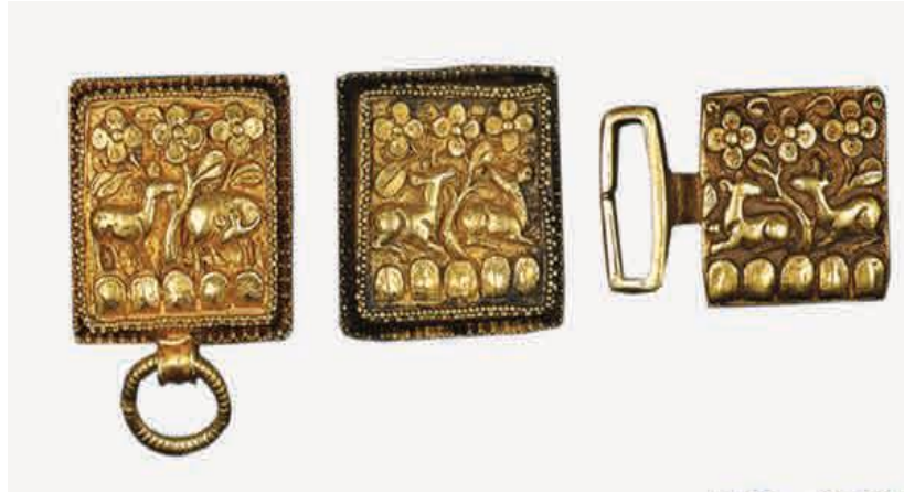
Görsel 11. Gold plates from a Mongol belt made in the 13th century, with a "zamak" buckle. D.N. Khalili Collection, London 41 .