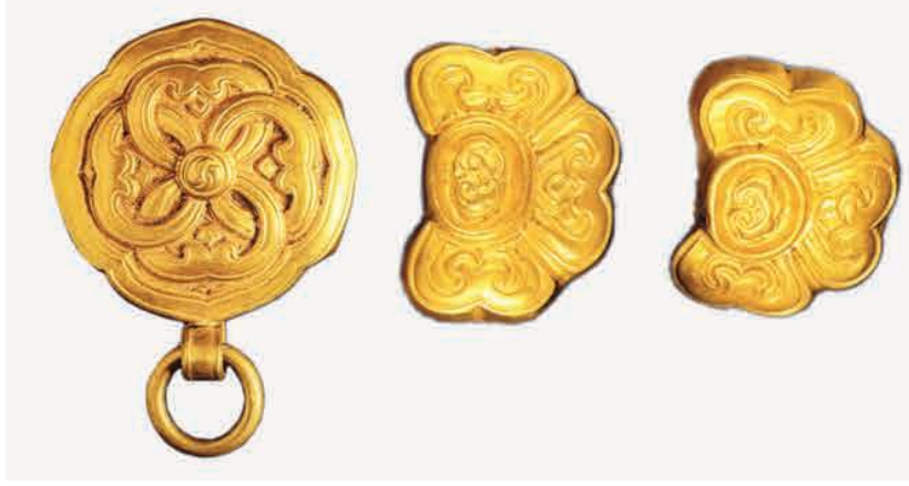
Görsel 9. A set of gold belts from the Great Mongol Empire, 13th century. Beijing 39 .