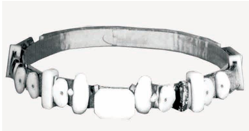
Görsel 8. A jade belt set from the Yuan Empire, 13th-14th centuries, Beijing 38 .