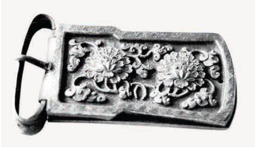
Görsel 6. A gold belt buckle from the Yuan Dynasty 36 .