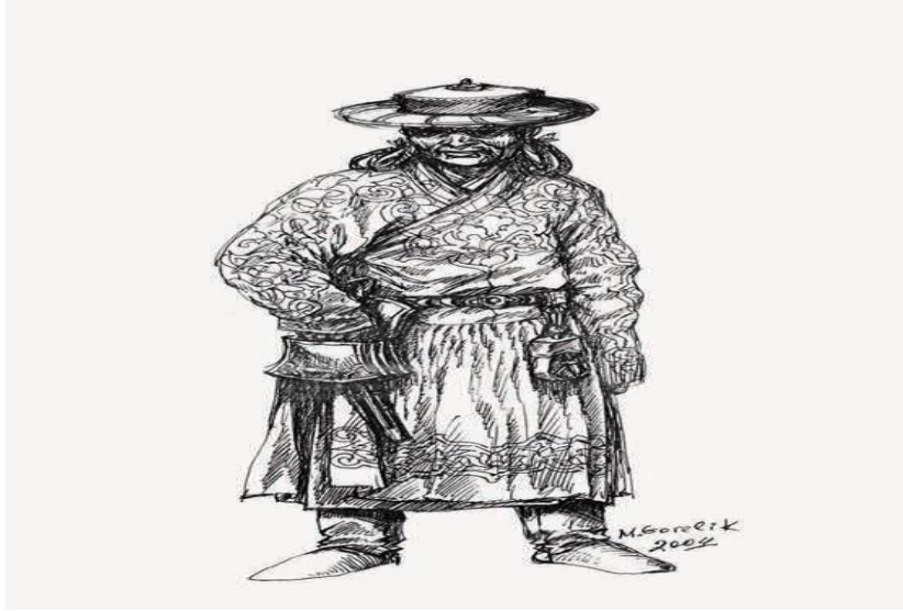
Görsel 14. A palace costume from the early 14th century, drawn from archaeological findings 44 .