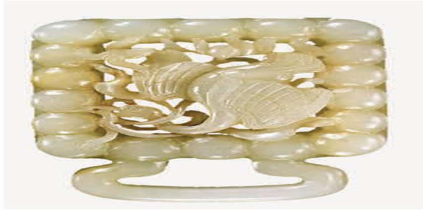
Görsel 7. A jade stone frame used in Mongol belts from the Yuan Dynasty period. Metropolitan Museum, New York. The pearls on the edges of this motif, crafted by a Chinese artist, are a characteristic detail of Mongol metal accessories 37 .