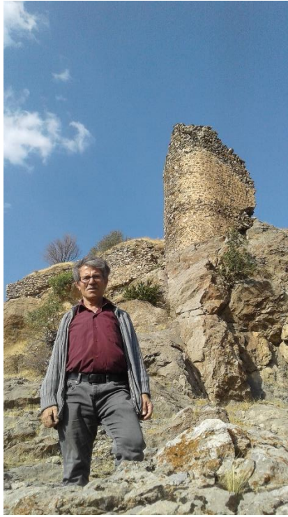
(Kelhê Sunbanê şekil: II)