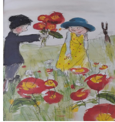
Şekil 4: (Ringtved, 2022)