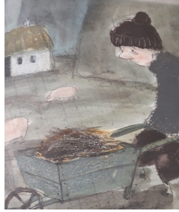
Şekil 2: (Ringtved, 2022)