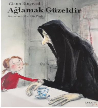
Şekil 1: (Ringtved, 2022)