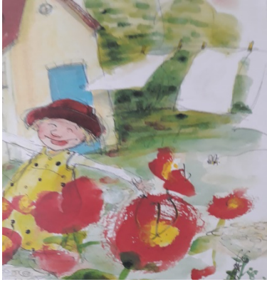
Şekil 3: (Ringtved, 2022)