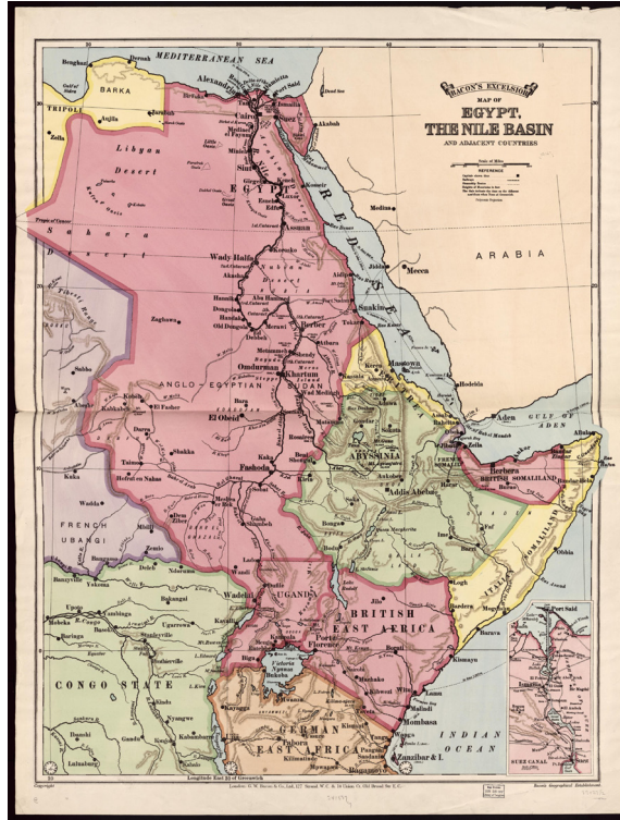
Historical map of Nile Basin Geography done by the American mapmaker George Washington Bacon in 1916 (Library of Congress, 2009).

largest tributaries flowing into Lake Victoria. Kagera originates from Lake Tanganyika in Burundi, south of Lake Victoria. The Kagera River flows into Lake Victoria after covering a distance of 690 km from south to north.*** The Nile is known as the Victoria Nile after it emerges from Lake Victoria and continues for a distance of 500 km, passing through Lake Edward until it reaches Lake Albert and then the Nile is known as the Albert Nile. When it reaches South Sudan it is called Bahr-el Jabel (Mountain River). The two branches of the Nile River are called Bahr el Ghazal (Gazelle River) and Bahr al-Arab (Arabian River) in Sudan, and the two Nile branches flow towards the north. The Blue Nile, originating from Lake Tana in Ethiopia, joins the White Nile in Khartoum and continues towards the north. As the White and Blue Nile continue towards the north, they merge with the 800 km long Atbara River starting from Ethiopia, 300 km north of Khartoum. The Atbara River dries up in winter. After that, the Nile River continues to flow through Egyptian territory to its mouth in the Mediterranean (Encyclopaedia, 2015).