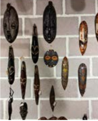
Fotoğraf 8: Afrika Kùltür Evi: Sergilenen ve aynı zamanda satıřa sunulan maskelerin bir bölümü