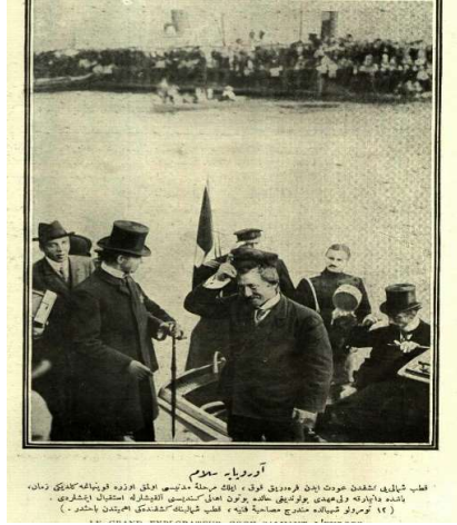
Görsel 4: Kuzey Kutbu seyahatinden dönen Doctor Cook'un karşılanması 31

Yine Şehbal Dergisi 'ne yansıyan bir ziyafet fotoğrafı bu konunun insanlık üzerinde ne denli bir coşkuyla karşılandığını göstermektedir.