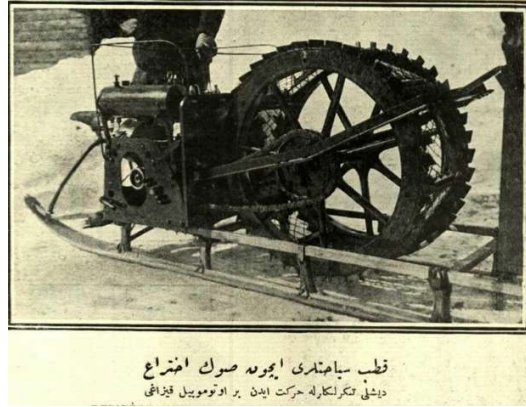
Görsel 3. Kutuplarda kullanılan otomobil kızığı 19

Şehbal mecmuasının 23. sayısında yayımlanmış olan diğer bir yazıda ise Kaptan Amundsen’in seyahat ayrıntıları hakkında bilgiler verilmiştir. Buna göre Güney kutbunu keşfeden Kaptan Amundsen, yolculuğa çıkarken gemide üç büyük sandık içinde otomobil kızığı, nakliyat için 19 at, 33 köpek bulundurmıştır. Özellikle atlara büyük önem verdiklerinden bahsedilmiştir. Amundsen ve ekibi kutbun keşfinde önemli bir rol oynayacağını düşündükleri atları Mançurya’dan getirmişlerdir. Yolculuklarının sorunsuz şekilde geçmesi için atlara birinci sınıf yolcu muamelesi yapılmıştır. Bunun dışında gemide 33 köpek de bulunmuştur. Sefer ekibinde ise 7 bahriye zabiti, 11 doğa bilimci, otomobil kızığını kullanması için bir makinist, 1 de süvari yüzbaşı zabiti olmak üzere toplam 51 mürettebat bulundurmışlardır. 18