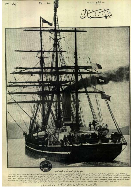
Görsel 2. Kutup Yolcuğuna çıkan Terra Nova Gemisi 12

Gemi ile yapılan seyahatler hem sayıca daha fazla hem de genellikle bir sonuca ulaştığı için elbette basında daha fazla yer bulmuştur. Bu seyahatlerle ilgili yazılan yazılar sadece birer haber niteliği taşımamış duyulan merakı ve heyecanı da yansıtmıştır. Yazılara yansıyan bu hisler Osmanlı basınının dolayısıyla aydınının dünyadaki bilimsel teşebbüslere duydukları ilgiyi de ortaya koymaktadır. Bahsi geçen yazılara birkaç örnek vermek gerekirse Kaptan Scott'un kaptanlığını yaptığı keşif yolculuğunun başlangıcında çekilen fotoğrafın altına not düşülmüş olan bilgilerden başlanabilir: