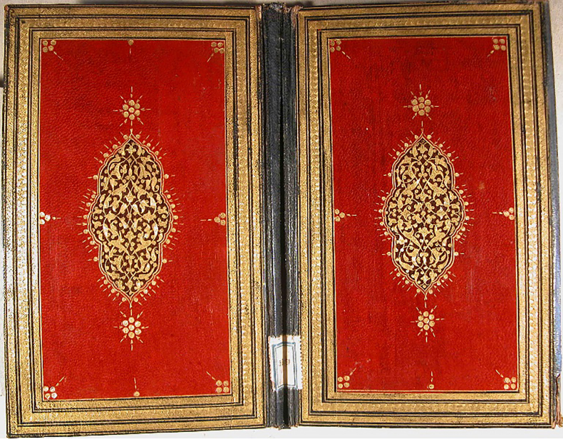
Fotoğraf 15: 599 Demirbaş numaralı ez-Zeria ilâ mekârimi's-şeria

Yüzeyinde yer alan süsleme kompozisyonu \frac{1}{4} simetrik olarak düzenlenmiş olup, kıvrım dalların taşıdığı palmet ve rûmîlerden oluşmaktadır. Salbekler altın noktalarla oluşturulmuş ve kenarlarına tığlar çekilmiştir. Miklebin kenarları kapaklarla aynı olup şemsesi oval formudur. Eser 1175 (1761-1762) tarihlidir. Cildi, eserin yazıldığı XVIII. yüzyıla tarihlendirmek mümkündür (Fotoğraf 15).