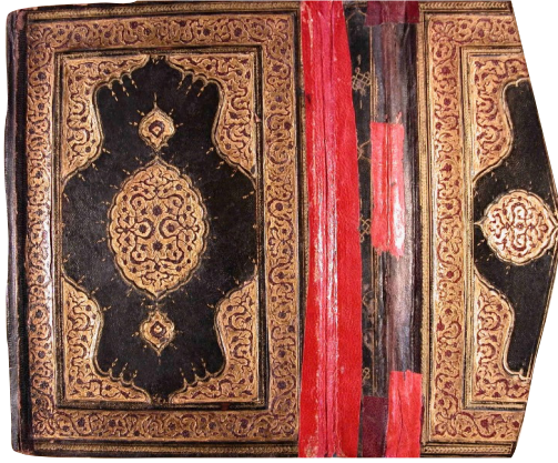
Fotoğraf 6: 4903 Demirbaş numaralı Ravzatü'l-ahyâr