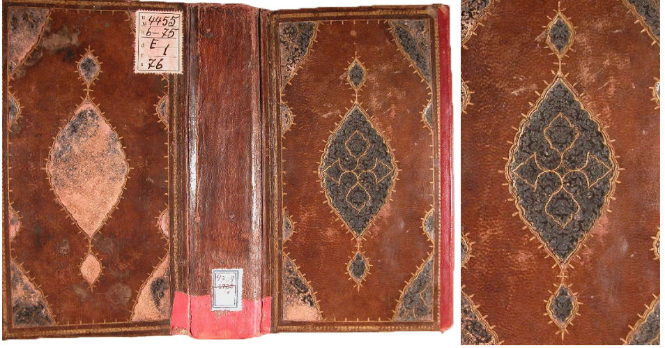
Fotoğraf 4: 4709 Demirbaş Numaralı Şerhu'l-Makâsıd

kahverengi deriyle yapılmış, kapakların etrafı sarmal zencereklî altın cetvellerle çerçeveslenmiştir. Köşebent uygulamasına rastlanmayan kapakların ortasında oval formlu dilimli şemseler görülmektedir. Şemselerde ortada irice birer kenger yaprağı motifi görülürken, bu motifi çevreleyen ince kıvrım dalların taşıdığı saz yapraklar ve hatâyî grubu çiçekler kompozisyonu tamamlamaktadır. Şemselerin çevresinde altın tığlar bulunmaktadır. İç kısımları hatâyî motifiyle tezyin edilen palmet biçimindeki salbekler nokta şeklinde orta bağlarla şemseye bağlanmıştır. Cildin sırt kısmı kırmızı tamir derisinin altında kalmıştır. Sertap, dikdörtgen biçimli iki kartuşa bölünmüş, ortalarına ise beşer adet altın nokta yerleştirilmiştir. Miklebin kenarları sarmal zencereklî altın cetvelle çevrilerek üçgen biçimli uç kısmına dik gelecek şekilde yuvarlağa yakın oval ve dilimli bir şemse yerleştirilmiştir. Şemsenin yüzeyi hatâyî motifi ile bezenirken, kenarlarında altın tığlar görülmektedir. Kapakların iç kısımları ebrulu kâğıtla kaplanmıştır. Eser 851 (1447-1448) yılında yazılmıştır. Cilt, şemselerinde kenger yaprağı motifi kullanımı ile Köprülü Kütüphanesi Fâzıl Ahmed Paşa koleksiyonunda yer alan 69 numaralı 1565-1566 tarihli cilt 19 ve Râşit Efendi Kütüphanesi'nde bulunan 1597 tarihli 442 numaralı ciltle 20 benzerlik göstermektedir. Bu benzerlikten yola çıkılarak cildi XVI. yüzyıla tarihlendirmek mümkündür (Fotoğraf 5).