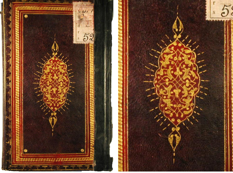
Fotoğraf 14: 36 demirbaş numaralı Meşâriku'l-envâri'n-nebeviyye min sıhâhi'l-ahbâri'l-Mustafaviyye

36 demirbaş numaralı Meşâriku'l-envâri'n-nebeviyye min sıhâhi'l-ahbâri'l-Mustafaviyye adlı eser 175x105 mm. ölçülerindedir. Bordo renkli deriyle kaplanan eserin her iki kapağı ve miklebi aynı düzende yapılmıştır. Ciltte şemselerin zemini ve zencerekli cetvellerin içinde kalan boşluklar kırmızıya boyanarak mülevven tekniği uygulanmıştır. Aynı zamanda şemselerde yekşah tekniği görülmektedir. Kapak köşelerine birer altın nokta yerleştirilmiştir. Kapakların ortasındaki şemseler ortası bombeli, kenarları dilimli dikdörtgen şeklindedir. Şemse kompozisyonu, kıvrım dalların üzerindeki rûmî ve palmet motiflerinden oluşmaktadır. Dilim aralarına tığlar çekilen şemselerin uçlarında salbekler mevcuttur. Miklep kapakla uyumlu bir şekilde düzenlenmiş, üçgen biçimli uç kısmına dilimli oval bir şemse yerleştirilmiştir. Eser 1166 (1752-1753) yılında yazılmıştır. Kompozisyon ve teknik özellikleri bakımından cilt, eserin yazıldığı döneme, XVIII. yüzyıla atfedilebilir (Fotoğraf 14).