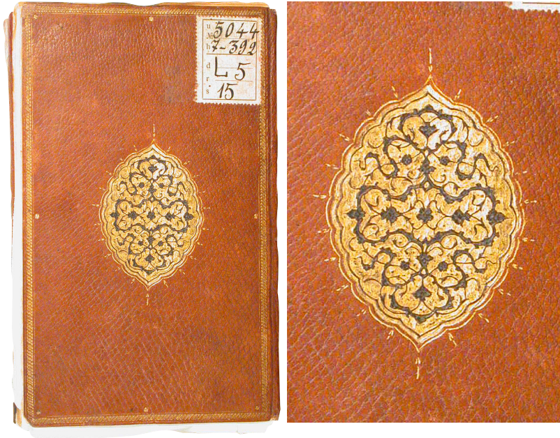
Fotoğraf 11: 260 Demirbaş numaralı Nefhatü'l-üns fi şerhi Ravzati'l-kuds

şeklinde salbekler mevcuttur. Miklep kapaklarda olduğu gibi zencereklî cetvelle çevrelenmiş ucuna dilimli ve oval biçimli şemse yerleştirilmiştir. Şemse kapaklardaki şemselerle aynı bezemeye sahiptir. Kapakların iç kısmı ebrulu kâğıtla kaplanmıştır. Ketebe kaydı bulunmayan eser şemselerdeki kompozisyon ve etrafında yer alan noktalardan yola çıkılarak XVII. yüzyıla atfedilebilir. Raşit Efendi Kütüphanesi'ndeki 938 numaralı 1688 tarihli eserin şemse ve salbeklerinin formu ve bezeme kompozisyonuyla 22 benzerlik göstermektedir (Fotoğraf 12).