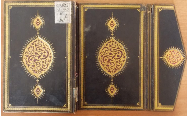
Fotoğraf 12: 4726 Demirbaş numaralı Hâşiye alâ Şerhi'l-Akâidi'l-Adudiyye

cetvelli olup, üçgen ucuna saz üslubunda bezenmiş dilimli damla formunda küçük bir şemse yerleştirilmiştir. Kapak içleri ebrulu kâğıtla kaplanmıştır. Yusuf Ağa tarafından kütüphaneye vakfedilen eser, ketebe kaydına göre Zilhicce 1155 (Ocak-Şubat 1743) tarihlidir. Bezeme kompozisyonu dikkate alındığında eseri, yazıldığı döneme XVIII. yüzyıla tarihlendirmek mümkündür (Fotoğraf 13).