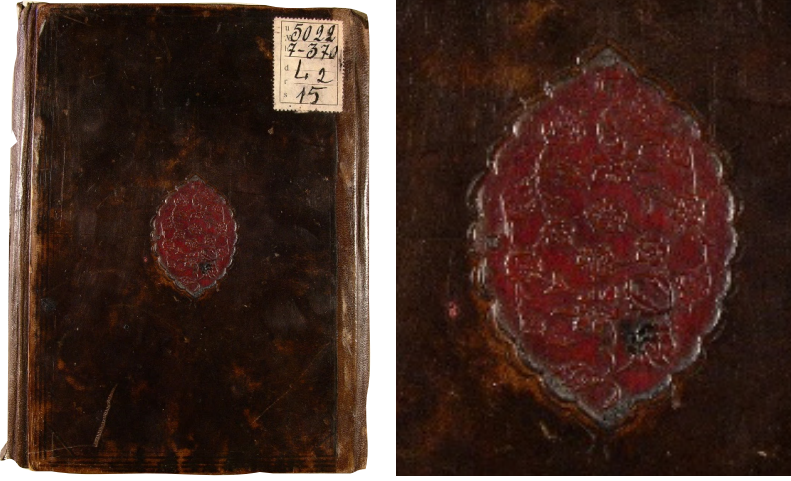
Fotoğraf 1: 4809 Demirbaş numaralı Tafsilü ikdi'l-ferâid bi-tekmîli Kaydi's-şerâid

5469 demirbaş numaralı Avârifü'l-maârif adlı eser 275x180 mm. ölçülerinde olup kapakları aynı şekilde tasarlanmıştır. Kapaklardaki şemseler ve salbekler mülevven ve alttan ayırma tekniğindedir. Cilt siyah deri ile mülevven kısımlar ise bordo deriyle kaplanmıştır. Şemse, salbek ve köşebentlerin tamamı gömme tekniğinde yapılmış ve kapakların etrafı sarmal zencereklî altın cetvellerle sınırlandırılmıştır. Köşebentlerde alttan ayırma tekniği tercih edilmiş, yüzeyleri ise saz üslubunda bezenmiştir. Şemseler dilimli ve oval biçimli olup, üzerinde bulunan saz üslubundaki kompozisyon dikey şekilde yerleştirilmiştir. Şemselerin uçlarında hatâyî motiflerle süslenen, beş dilimli palmet şeklinde salbekler mevcuttur. Sırt bölümü bezemesiz olan cildin iç kısımlarında da süsleme bulunmayıp, bordo renkli deri ile kaplanmıştır. Ketebe kaydına göre eser, Ramazan sonu 1000 (Haziran-Temmuz 1592) tarihinde yazılmıştır. Şemse, köşebent ve salbeklerin formu ve bu kısımların üzerindeki bezeme kompozisyonu değerlendirildiğinde, cildi XVI. yüzyıla eserin yazıldığı döneme atfetmek mümkündür (Fotoğraf 2).