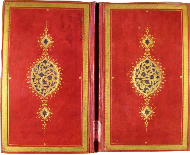
Fotoğraf 8: 4778 Demirbaş numaralı Sadrü’ş-şeria (Fotoğraf: Konya Yazma Eserler Bölge Müdürlüğü Arşivi’nden)

süslenmiştir. Kapaklardaki şemseler, salbekler ile miklep şemsesi mülevven ve alttan ayırma tekniğindedir. Kırmızı deri ile yapılan cildin mülevven kısımları siyah deriyle kaplanmıştır. Kapakların kenarları sarmal zence-rekli altın cetvellerle sınırlandırılmıştır. Gömme tekniğinde yapılan dilimli oval şemseler saz üslubunda süslenmiştir. Şemselerin kenarlarına altın tığlar çekilerek aralarına noktalar konulmuştur. Şemselerin uçlarında içlerinde birer hatâyî motifi bulunan beş dilimli palmet şeklinde salbekler bulunmaktadır. Sırt bölümü süslemesiz olup, sertap iki sıra altın cetvelle çevrelenmiş, bu kısmın içi altın noktalarla süslenmiştir. Miklebin ucundaki dilimli oval şemse de aynı teknik ve kompozisyonla tezyin edilmiştir. Cildin iç kısımları düz kâğıtla kaplanmış ve bezemesiz olarak bırakılmıştır. Eser ketebe kaydına göre Ramazan 1055 (Ekim-Kasım 1645) tarihinde yazılmıştır. Şemse, salbek ve sertapta kullanılan altın noktalar cildin yazıldığı döneme ait olduğunu göstermektedir (Fotoğraf 8).