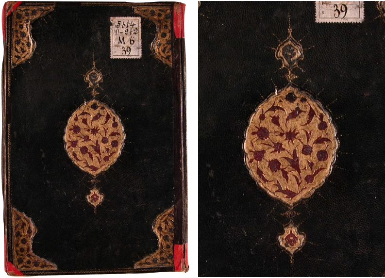
Fotoğraf 2: 5469 Demirbaş numaralı Avârifü'l-maârif

formdaki şemselerin de saz üslubunda bezendiği gözlenmektedir. Şemselerin uçlarında, irice birer hatâyî motifiyle süslenen beş dilimli palmet şeklinde salbekler görülmektedir. Etrafı altın cetvellerle çevrilen sertap yüzeyi üç kartuşa bölünmüş, kartuş yüzeyleri süslemesiz olarak bırakılmıştır. Miklep köşebentleri kapaktakilerle aynı biçimde olup, miklebin üçgen ucuna dik biçimde küçük bir dilimli oval şemse yerleştirilmiştir. Buradaki bezemeler teknik ve kompozisyon bakımından kapaktakilerle aynıdır. Kapakların iç kısımları kahverengi deriyle kaplanmış ve ortasına soğuk şemse tekniğinde dilimli ve oval biçimli birer şemse yerleştirilmiştir. Şemse yüzeyleri saz üslubunda bezenmiştir. Uçlarında içlerinde birer hatâyî motifi bulunan salbekler mevcuttur. Yusuf Ağa tarafından kütüphaneye vakfedilen eser ketebe kaydına göre 528 (1133-1134) tarihli olup Selçuklu dönemine aittir. Ancak kapaklarda görülen teknik, tasarım ve kompozisyon özellikleri cildin XVI. yüzyıl civarında kitaba takıldığını göstermektedir (Fotoğraf 3).