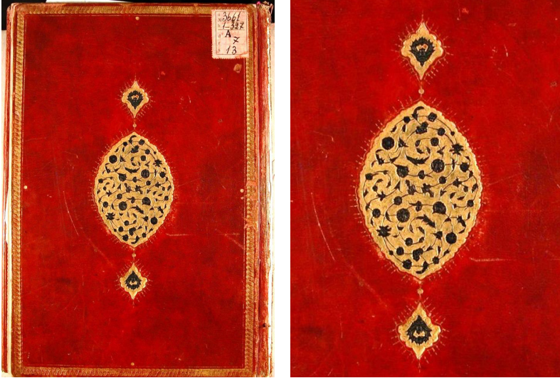
Fotoğraf 13: 5192 Demirbaş numaralı Tefsîru Ali el-Kârî

cetvelli olup, üçgen ucuna saz üslubunda bezenmiş dilimli damla formunda küçük bir şemse yerleştirilmiştir. Kapak içleri ebrulu kâğıtla kaplanmıştır. Yusuf Ağa tarafından kütüphaneye vakfedilen eser, ketebe kaydına göre Zilhicce 1155 (Ocak-Şubat 1743) tarihlidir. Bezeme kompozisyonu dikkate alındığında eseri, yazıldığı döneme XVIII. yüzyıla tarihlendirmek mümkündür (Fotoğraf 13).