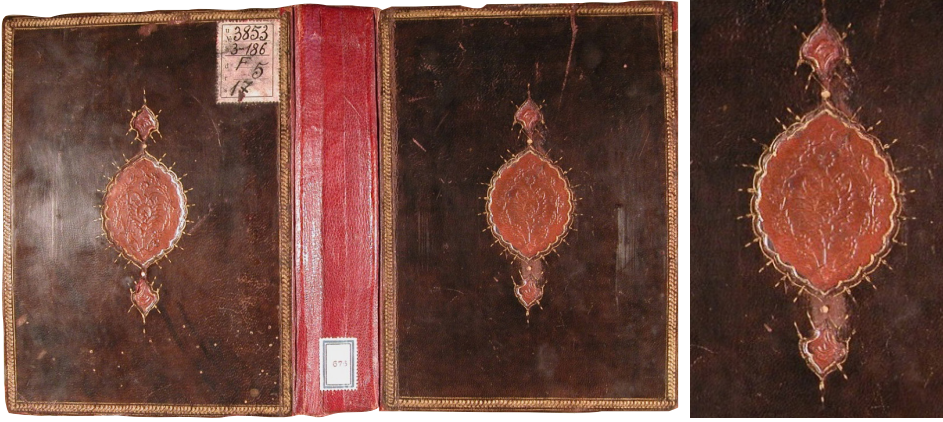
Fotoğraf 5: 676 Demirbaş numaralı Şerhu Şemâli's-şerif

4903 demirbaş numarasına kayıtlı Ravzatü'l-ahyâr adlı eserin müstensihisi Mehmed b. Sinan'dır. Eser 245x140 mm. boyutlarındadır. Kitabın dış kapaklarıyla miklebi aynı tasarımdadır. Bu kısımlarda şemseler, salbekler, köşebentler ve bordürler mülevven ve alttan ayırma tekniğinde bezenmiştir. Cilt siyah deriyle, mülevven kısımları bordo renkli deriyle yapılmıştır. Sarmal zencerekli cetvellerle sınırlanan bordürler köşelerde düğümlü, kenarlarda ise dolantı bulut motifleriyle süslenmiş, bulutların arasına kıvrım dalların taşıdığı hatâyîler yerleştirilmiştir. İç ve dış bükey kıvrımlı köşebentler ikişer adet serbest dolantı bulut motifi ve bulutlar arasına yerleştirilen hatâyî grubu motiflerle tezyin edilmiştir. Dilimli ve oval formlu şemseler ortada birbirine düğümlenen bulut motifleri ile kıvrım dalların taşıdığı hatâyîlerin bulunduğu \frac{1}{4} simetrik bir kompozisyonla tezyin edilmiştir. Şemselerin ucunda, içlerinde irice bir hatâyînin bulunduğu beş dilimli palmet şeklinde salbekler bulunmaktadır. Şemseler, salbekler ve köşebentlerin etrafı altınla tığlanmıştır. Sertap onarım derisinin altındaki izlerden anlaşıldığına göre, dikdörtgen formlu üç kartuşa bölünmüş, içlerine birer düğüm motifi yerleştirilmiştir. Miklep, kapaktaki bezemenin \frac{1}{2} si şeklinde olup dilimli oval şemsesi miklep ucuna dikey yönde yerleştirilmiştir (Fotoğraf 6).