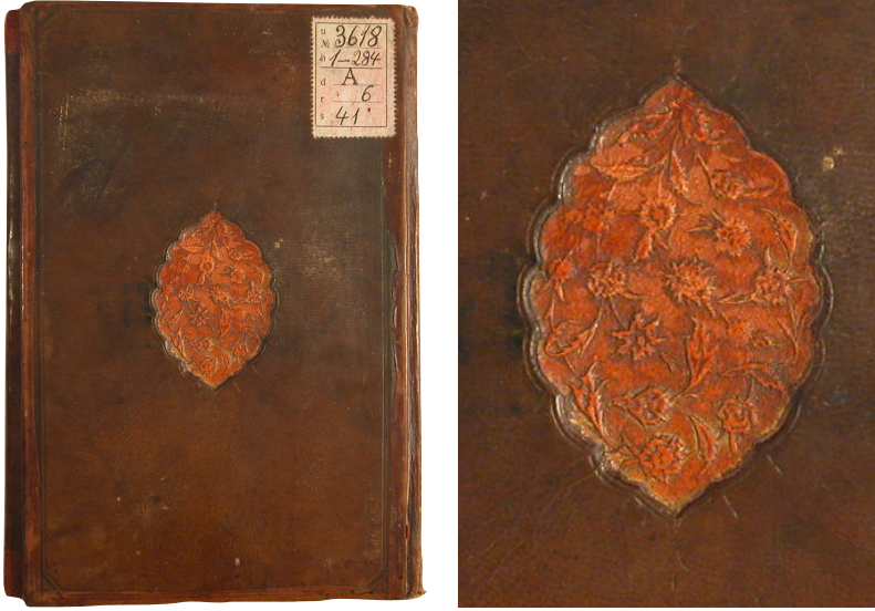
Fotoğraf 9: 195 Demirbaş numaralı Ta'likât alâ Tefsîri'l-Kâdi Beyzâvi

kaplanmıştır. Eser ketebe kaydına göre Recep 1063 (Mayıs-Haziran 1653) tarihinde yazılmıştır. Cilt, bezeme kompozisyonuna bakılarak eserin yazıldığı XVII. yüzyıla tarihlendirilebilir (Fotoğraf 9).