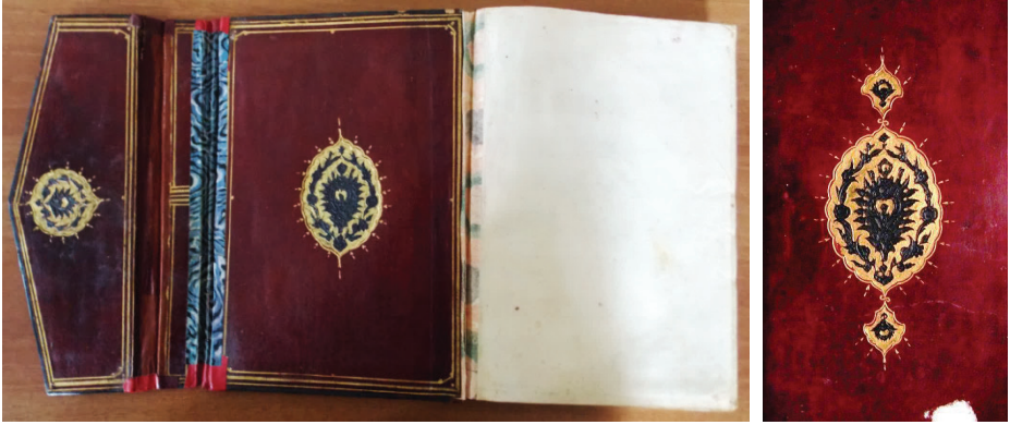
Fotoğraf 7: 4903 Demirbaş numaralı Ravzatü'l-ahyâr

hatâyiler dikkat çeker. Etrafı tek sıra tahrirlenerek dilimlerin arasına tığlar çekilmiştir. Miklebin ucundaki şemse daireye yakın oval biçimli olup iç kapaklardaki şemse ile benzer kompozisyondadır. Kütüphaneye Yusuf Ağa tarafından vakfedilen eser ketebe kaydına göre, Rebûlâhir ayının son 10'unun sonu 1014 (Eylül 1605) tarihlidir. Cildin iç kapak süslemesi çalışmamızda yer alan 676 demirbaş numaralı Şerhu Şemâli's-şerîf adlı eserin dış kapaklarındaki kompozisyonla benzemektedir. İncelenen eserin ketebe kaydı ve bezeme kompozisyonu değerlendirildiğinde cildi XVII. yüzyıla tarihlendirmek mümkündür (Fotoğraf 7).