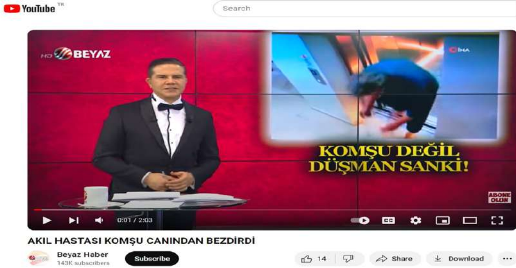
Şekil 3. Akıl hastası komşu canından bezdirdi! haberi (Beyaz TV, 2021).