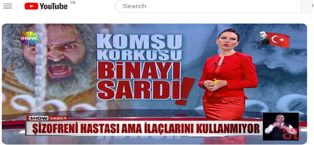
Şekil 1. Komşu korkusu binayı sardı haberi (SHOW Haber, 2021).