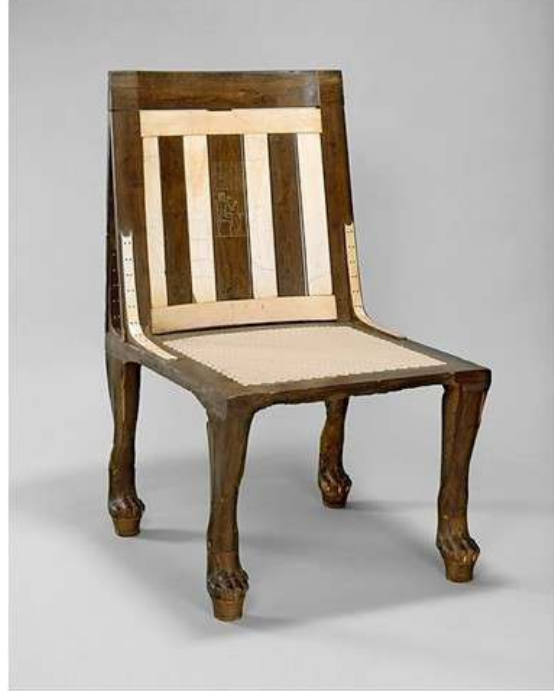
Şekil 5. Chair of Reniseneb , ca. 1450 B.C.

Bu teknik Chair of Reniseneb 'te görülebilir (bkz. Şekil 5).