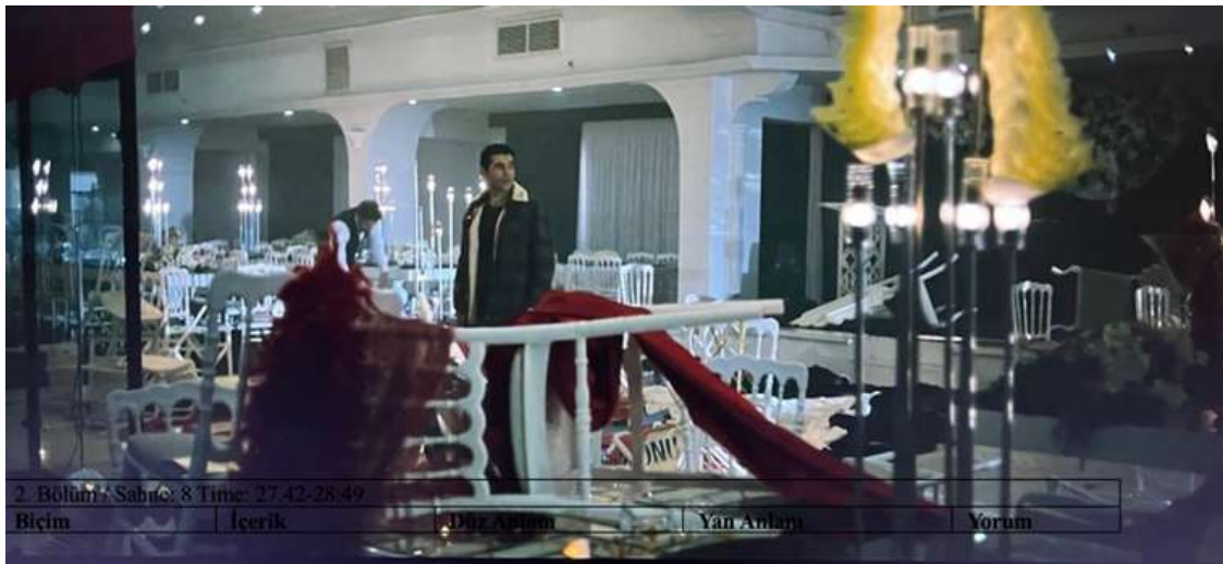
Picture 3. Episode 2 - Scene 8

In this scene, designed as an extension of an old memory, there is a reference to the continuity of the time-space relationship, and the scene is constructed with this understanding. The bench, conceptualized as an image between the disruptions and reunions in the ongoing relationship of two individuals, is described as a space where they sit during the times they do not see each other, providing an emotional imagery through this bench.