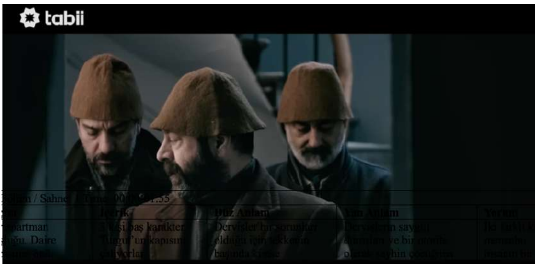
Picture 1. Episode 1 - Scene 1

In the context of semiotics theory, summarized as the study of the image behind what is said and shown in cinema, a series of observations have been made regarding certain scenes in an eight-part series. These observations focus on the fundamental form, content, literal and connotative meanings of the scenes. The selection of shots is crafted to reflect the situation surrounding the main character, especially in the first sequence of the same shots, through the choice of rich and expressive shots.