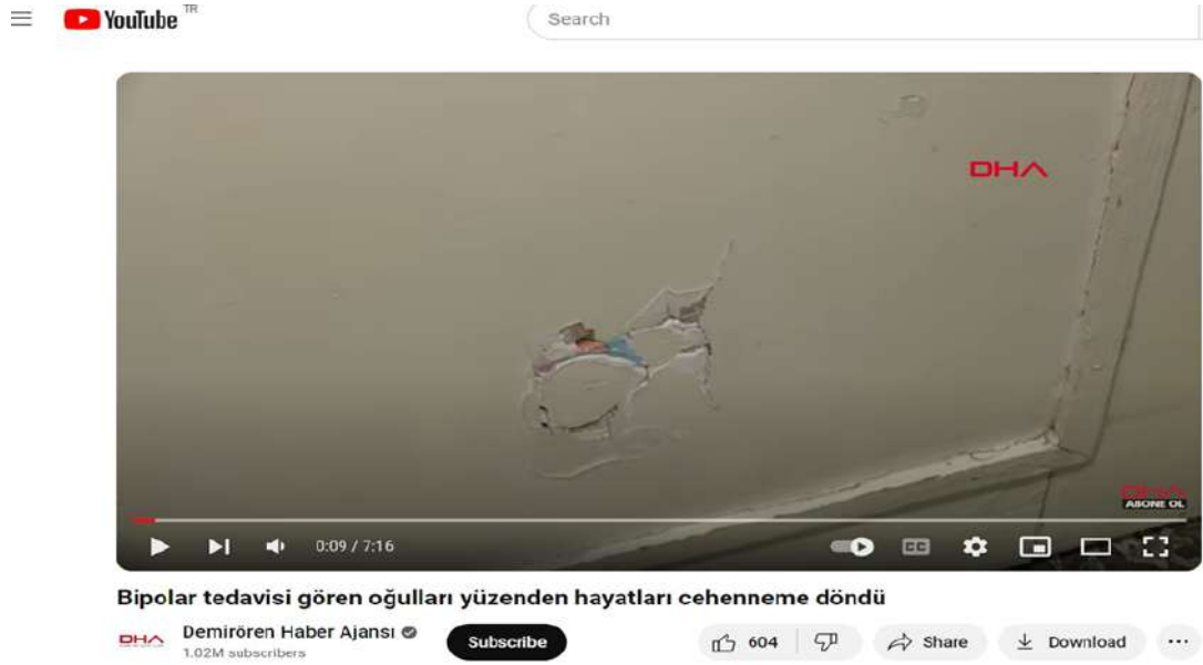
Şekil 2. Bipolar tedavisi gören oğulları yüzünden hayatları cehenneme döndü haberi (DHA, 2020).