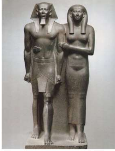
Şekil 2. Menkaure ve Khamerenebty kraliyet heykeli , c. 2470 BCE (Bell, 2007: 42)

Bu teknik Menkaure ve Khamerenebty kraliyet heykeli eserinde görülebilir (bkz. Şekil 2).