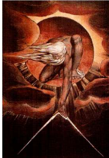
Şekil 1. The Ancient of Days, W. Blake, 1794/1824 (Bell, 2007, s. 305)

Bu teknik The Ancient of Days eserinde görülebilir (bkz. Şekil 1).