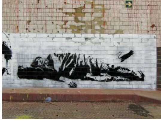
Şekil 4. Sleeping Man , Blek Le Rat, 2008.