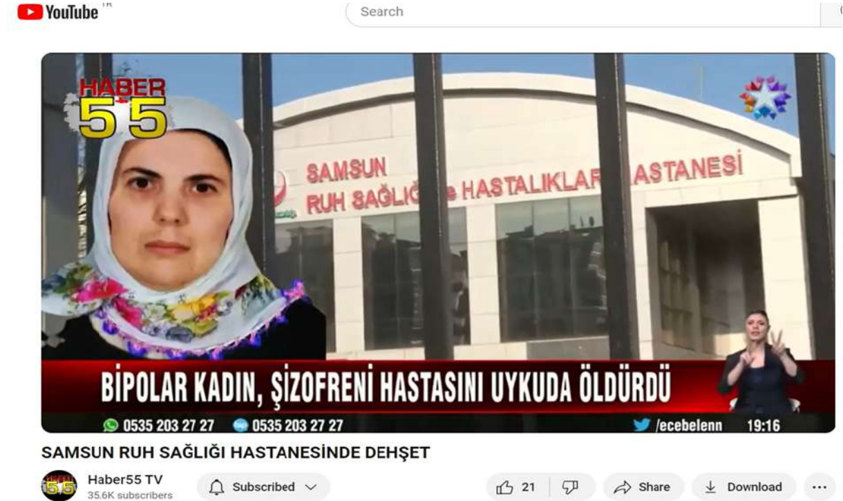
Şekil 4. Ruh sağlığı hastanesinde dehşet haberi (Haber 55, 2020).