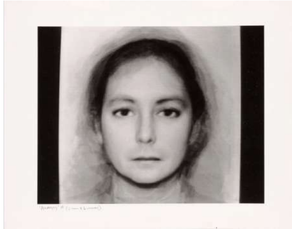
Şekil 3. Androgyny , N. Burson, 1982.

Thompson, M. (2020). Canyon wren [Photograph]. Flickr. https://flic.kr/p/2icfzq4 Bu teknik Androgyny 'de görülebilir (bkz. Şekil 3).