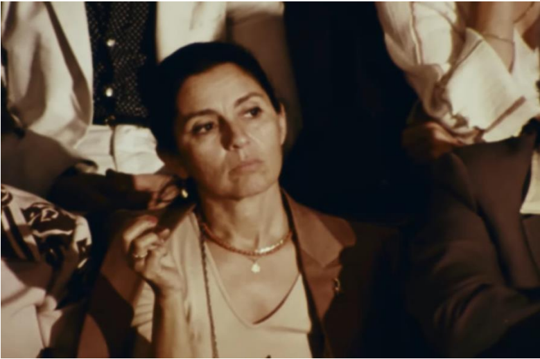
Sandal Bedesteni'nde Müzayedeyi İzleyen Bir Kadın