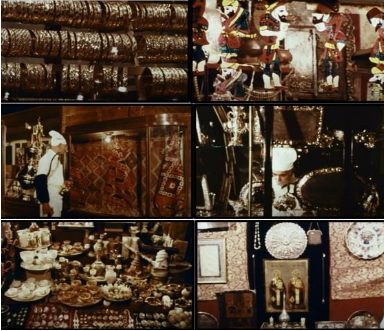
Kapalıçarşı'da Sergilenen Çeşitli Eşyalar