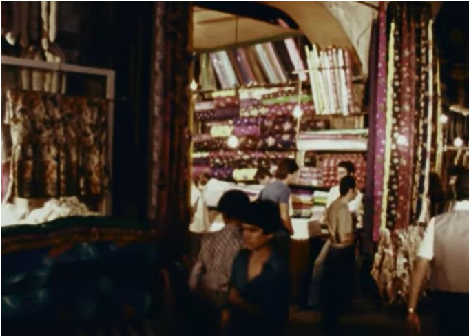
Yağlıkçılar Sokağındaki Vitrinsiz Dükkanlar