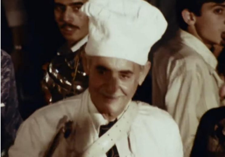
Kaynak: Arın (1980)