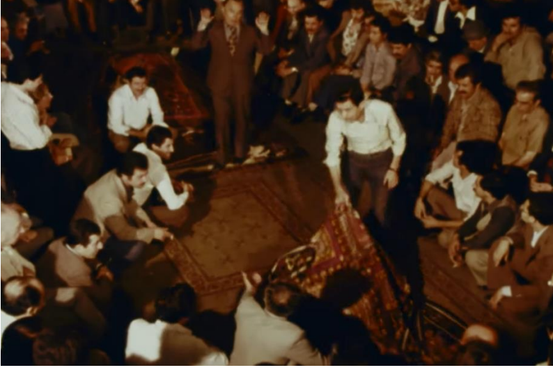
Kapalıçarşı'da Unutulmuş Bir Gelenek Açık Müzayede