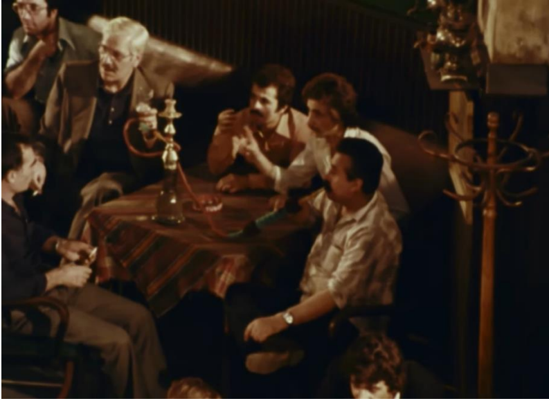
Kapalıçarşı'nın En Gözde Yerlerinden Şark Kahvesi