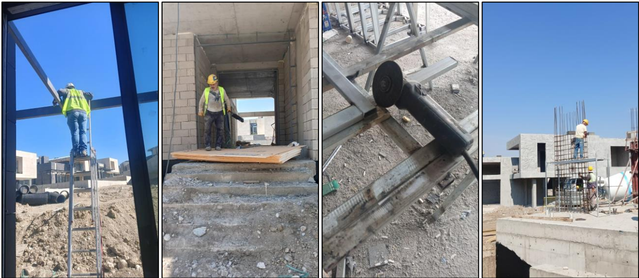
Şekil 4. Şantiyede risk oluşturacak unsurlar

İlk olarak, inşaat sahası ziyaret edilerek gözlemlerin yapılması planlanmıştır. Gözlem yoluyla, işçilerin günlük çalışma pratiklerini, iş güvenliği prosedürlerini uygulama şekillerini ve olası riskleri doğrudan gözlemleyip notlar alınıp kayıt altına alınmıştır (Şekil-4).