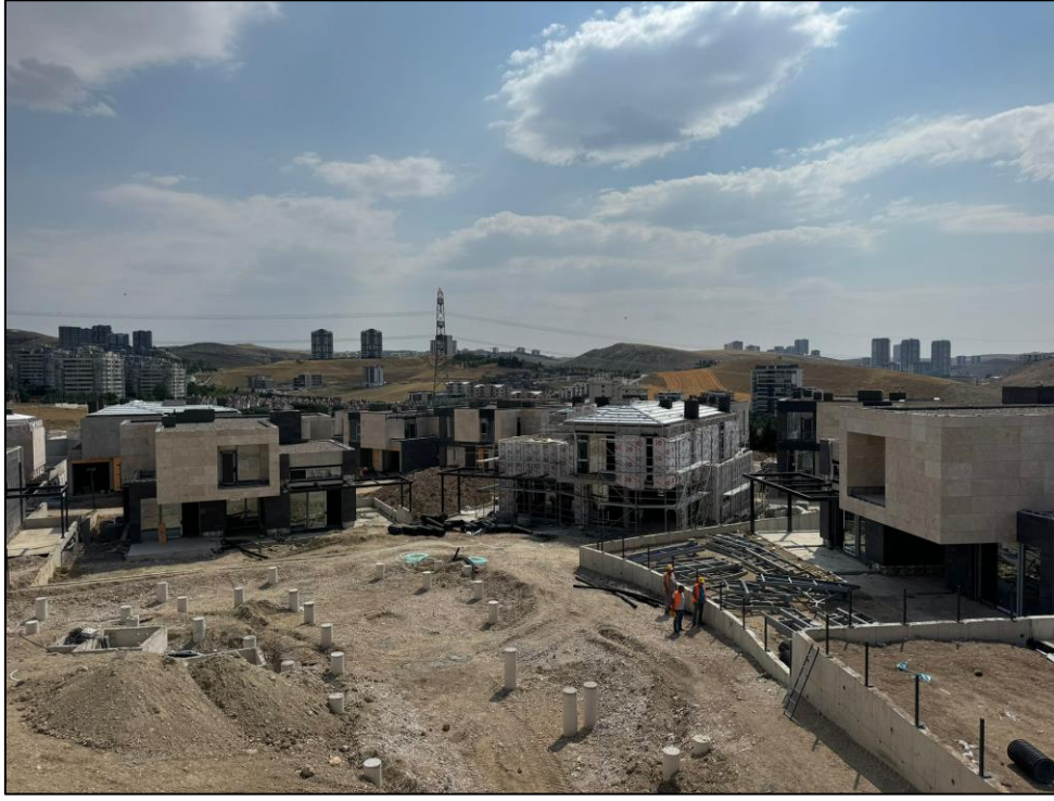
Şekil 3. Risk analiz bölgesinin genel bir görüntüsü

Yapılacak olan iş sağlığı ve güvenliği araştırmasında katılımcıların ve inşaat firmasının haklarına ve gizliliklerine saygı göstermek önemlidir. Bu nedenle etik kurallara uygun olarak çalışma yapılmasına özen gösterilmiştir.