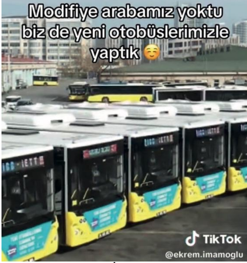
Resim 5: Ekrem İmamoğlu’nun en fazla etkileşim alan paylaşımından bir kare

“Kendi öz kaynaklarımızla aldığımız 150 otobüs daha İstanbul’umuza hizmet vermeye başlıyor” açıklamalı, belediyeye ait otobüs görüntülerinin trend olarak ifade edilebilecek bir şarkı ile yer aldığı ve hazır video şablonu ile oluşturulmuş video içeriğidir. Video içeriğinin üzerinde “Modifiyeli arabamız yoktu biz de yeni otobüslerimizle yaptık” açıklaması yer almaktadır. Video içeriğinde belediye başkanlığı sürecinde yapılmış olan bir çalışma o tarihte Türkiye’de var olan bir sosyal medya akımı ile işlenmiştir.