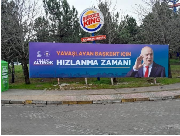
Şekil 5. Ak Parti Ankara Büyükşehir Belediye Başkanlığı adaylığı için tasarlanan afiş