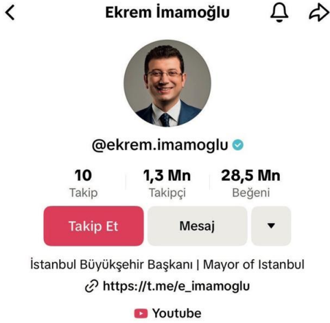
Resim 3: Ekrem İmamoğlu'nun TikTok profili

Murat Kurum'un 30 Mart 2024 tarihindeki güncel TikTok profili aşağıda yer alan görseldeki gibidir. Kurum'un da mavi tikli onaylanmış bir hesabı ve 162,8 bin takipçisi bulunmaktadır. TikTok'taki video içeriklerinin 3,5 milyon beğenisi olan Kurum'un beğeni sayısı takipçi sayısına oranla oldukça yüksek bir durumdadır. Profilindeki açıklamada İstanbul Büyükşehir Belediye Başkan Adayı ibaresi bulunan Murat Kurum, TikTok profilinde diğer sosyal medya platformlarında kullanmış olduğu profil resmini tercih etmiştir. Murat Kurum araştırma kapsamında belirlenmiş olan 1 Şubat ve 30 Mart tarihi aralığında 87 video içeriğini TikTok platformunda paylaşmıştır. Ekrem İmamoğlu'nun belirlenen tarih aralığındaki paylaşım sayısından daha fazla paylaşım sayısı bulunan Kurum'un TikTok platformunda oldukça aktif bir çalışma yürüttüğünü söylemek mümkündür.