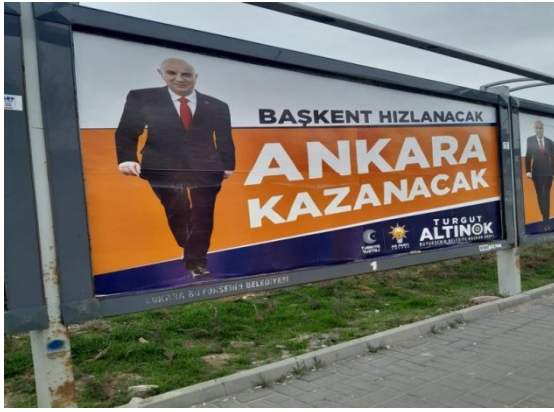
Şekil 3. Ak Parti Ankara Büyükşehir Belediye Başkanlığı adaylığı için tasarlanan afiş