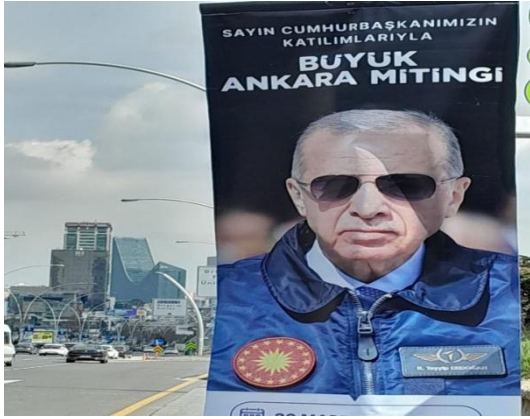
Şekil 2. Ak Parti Ankara seçim mitingi için tasarlanan afiş