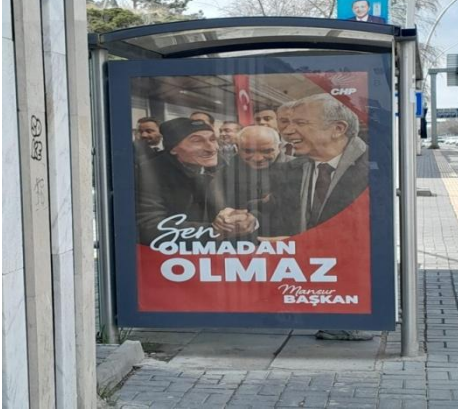
Şekil 6. CHP Ankara Büyükşehir Belediye Başkanlığı adaylığı için tasarlanan afiş