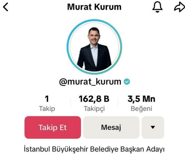
Resim 4: Murat Kurum'un TikTok profili

Murat Kurum'un 30 Mart 2024 tarihindeki güncel TikTok profili aşağıda yer alan görseldeki gibidir. Kurum'un da mavi tikli onaylanmış bir hesabı ve 162,8 bin takipçisi bulunmaktadır. TikTok'taki video içeriklerinin 3,5 milyon beğenisi olan Kurum'un beğeni sayısı takipçi sayısına oranla oldukça yüksek bir durumdadır. Profilindeki açıklamada İstanbul Büyükşehir Belediye Başkan Adayı ibaresi bulunan Murat Kurum, TikTok profilinde diğer sosyal medya platformlarında kullanmış olduğu profil resmini tercih etmiştir. Murat Kurum araştırma kapsamında belirlenmiş olan 1 Şubat ve 30 Mart tarihi aralığında 87 video içeriğini TikTok platformunda paylaşmıştır. Ekrem İmamoğlu'nun belirlenen tarih aralığındaki paylaşım sayısından daha fazla paylaşım sayısı bulunan Kurum'un TikTok platformunda oldukça aktif bir çalışma yürüttüğünü söylemek mümkündür.