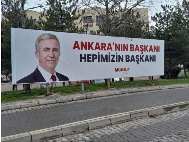
Şekil 8. CHP Ankara Büyükşehir Belediye Başkanlığı adaylığı için tasarlanan afiş