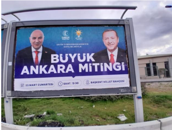
Şekil 1. Ak Parti Ankara Büyükşehir Belediye Başkanlığı adaylığı için tasarlanan afiş