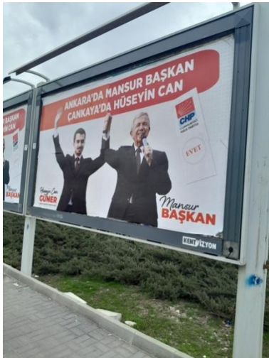
Şekil 9. CHP Ankara Büyükşehir ve Çankaya Belediye başkanlığı adaylığı için tasarlanan afiş