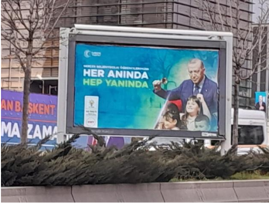
Şekil 4. Ak Parti Ankara Büyükşehir Belediye Başkanlığı adaylığı için tasarlanan afiş