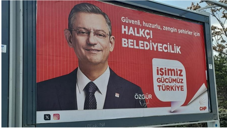
Şekil 10. CHP 31 Mart 2024 yerel seçim afişi