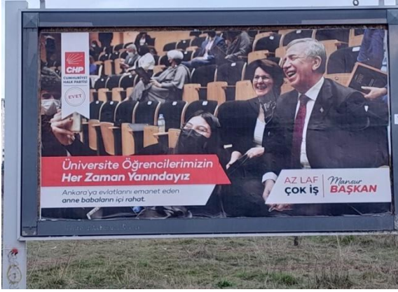
Şekil 7. CHP Ankara Büyükşehir Belediyesi Başkanlığı adaylığı için tasarlanan afiş