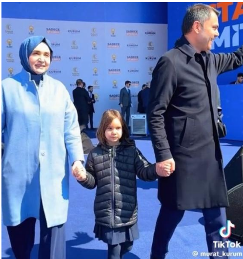
Resim 6: Murat Kurum’un en fazla etkileşim alan paylaşımından bir kare

Murat Kurum’un TikTok profilinde belirlenen tarih aralığındaki video içerikleri incelendiğinde en fazla etkileşim alan video içeriğinin “Ailem” açıklaması ve #Sadecelistanbul açıklaması ile paylaşılan, Kurum’un ailesi ile birlikte miting alanına yürürken işlenmiş bir video içeriği olduğu görülmüştür. 90 bin beğeni alan video içeriği yine o dönem trend olarak nitelendirilebilecek bir şarkı ve sosyal medya akımı eşliğinde kurgulanmıştır. Paylaşımında etiket diğer bir ifade ile hashtag kullanımına gidilmiş olması da dikkat çekmiştir.