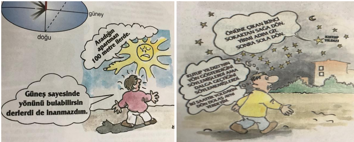
Şekil 3. 2005 ders kitabında yer alan mekânı algılama becerisine yönelik örnek görseller

2005 ders kitabında mekânı algılama becerisine yönelik olarak, kavram karikatürü niteliğindeki çizimlerden yararlanıldığı görülmektedir.