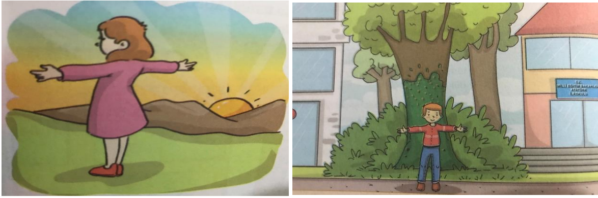
Şekil 4. 2018 ders kitabında yer alan mekanı algılama becerisine yönelik örnek görseller

2018 ders kitabında yer alan görsellerin metne göre çizilen resimler olduğu dikkat çekmektedir. 2005'te kullanılan, karikatür niteliğindeki çizimlerin, çocukların resme baktıklarında ne anlatılmak istendiğini daha iyi anlamalarını sağlayacağı, kazandırılmak istenen becerilerin somutlaştırılmasına yarayacağı ve sınıf içi tartışma ortamı yaratarak öğrencilerin sürece aktif katılımlarını arttıracığı düşünülmektedir.