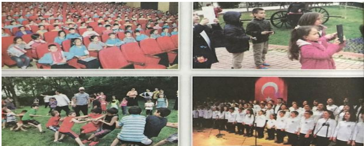
Şekil 6. 2018 ders kitabında yer alan sosyal katılım becerisine yönelik örnek görseller

2005'te sosyal katılım becerisine yönelik olarak kullanılan görsellerin, dilekçe örneği ve gazete haberlerinden örnekler gibi gerçek hayat durumlarıyla ilgili olduğu görülmektedir.