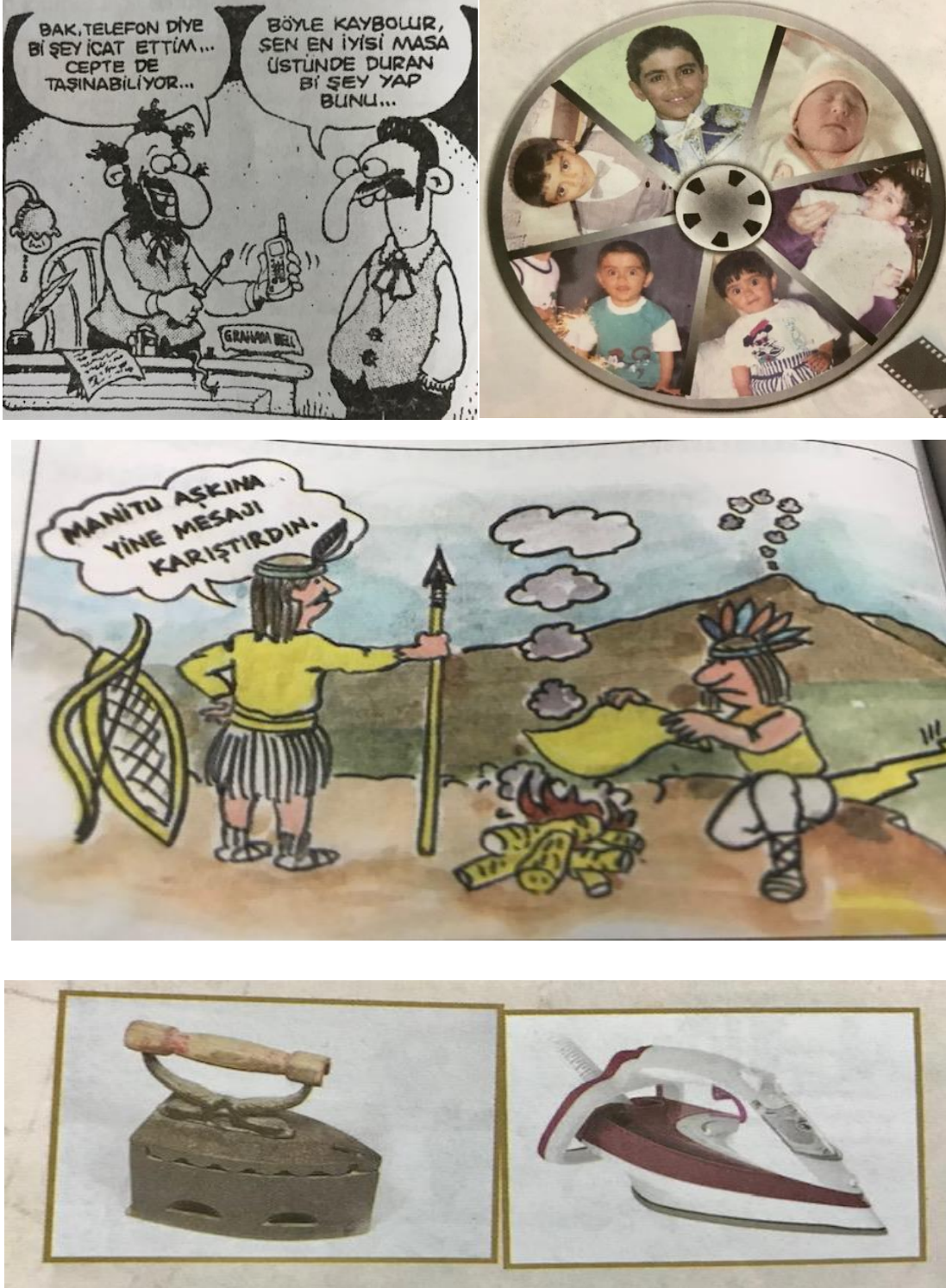
Şekil 1. 2005 ders kitabında yer alan değişim ve sürekliliği algılama ile zaman ve kronolojiyi algılama becerilerine yönelik örnek görseller

2005 ders kitabında sıklıkla kavram karikatürlerine yer verildiği görülmektedir. Karikatürler dışında kullanılan görseller ise; genellikle gerçekçi nitelikte; yani günlük yaşama uygun, yaşamda karşılaşılan resimlerdir.