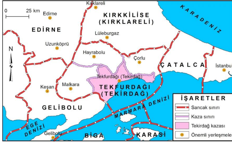
Şekil 2. 1900'lü Yılların Başında Tekirdağ ve Çevresinin İdari Taksimi Haritası (Özşahin ve ark., 2016, s.310)

Nüfusun doğal seyriyle (doğumlar-ölümler) birlikte savaşlar, göçler ve iskân politikaları Tekirdağ nüfusunun değişiminde etkili faktörler olmuştur. Osmanlı Dönemi Tekirdağ ve bağluların nüfus özellikleri incelendiğinde, modern anlamda ilk nüfus sayımı olarak değerlendirilen 1831 yılı sayımlarında sadece erkek nüfusun tespiti yapılmıştır. Sayıma göre Tekirdağ nüfusu 11.557, Malkara 5.585, Çorlu 3.027, Hayrabolu 3.254, İncecik 1.672, Ereğli 755 kişi olmak üzere toplamda 25.850 kişidir (Kartal, 1995, s.195). Kadın nüfusun da sayıma dahil edildiği 1881/82- 1893 tarihi nüfus tespitinde Tekirdağ Sancağı nüfusu 48.072'si kadın, 52.629'u erkek olmak üzere toplam 100.701 kişidir (Kanal, 2015, s.107). 1905-1906 yıllarını kapsayan nüfus sayım devresinde ise sancağın nüfusu 159.002 olarak tespit edilmiştir (Kanal, 2015, s.112). Türkiye Cumhuriyeti ilk nüfus sayımı olan 1927 yılında Tekirdağ nüfusu 131.446 kişi olarak kaydedilmiştir (Behar,1996, s.63).