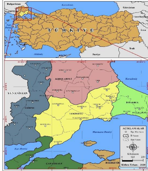
Şekil 1. Tekirdağ İli Lokasyon Haritası

Tekirdağ ili, Türkiye'nin kuzeybatısında, Marmara Denizi'nin hemen kuzeyinde, Marmara Bölgesi Ergene ve Çatalça-Kocaeli Bölümü'nde yer almaktadır. İl topraklarının tamamı Trakya'da yer alan Tekirdağ'ın güneyde Marmara Denizine, kuzeyde Karadeniz'e kıyısı bulunmaktadır (Şekil 1). Süleymanpaşa, Marmara Ereğlisi, Şarköy ve Çorlu, Marmara denizine kıyısı bulunan ilçelerdir. Marmara Ereğlisi Sultanköy ile Şarköy İlçesi Kızılcaterzi Köyü sınırları arasında kıyı uzunluğu 150 km'dir (İnan, 2006, s.107). Malkara, Hayrabolu, Muratlı, Ergene, Çerkezköy ve Kapaklı ilçeleri denize kıyısı olmayan Trakya'nın iç kesiminde kalan ilçeleridir. Kuzeydoğuda yer alan Saray ilçesinin ise Karadeniz kıyısıyla 2,5 km'lik kıyı uzunluğu bulunmaktadır (Eroğlu, 2016, s.191; İncekara, 2006, s.117). İl toprakları, doğudan İstanbul (Silivri,Çatalca), kuzeyden Kırklareli (Vize, Lüleburgaz, Babaeski ve Pehlivan köy), batıdan Edirne (Keşan, Uzunköprü) ve Çanakkale (Gelibolu), güneyden ise Marmara Denizi ile çevrelenmiştir.