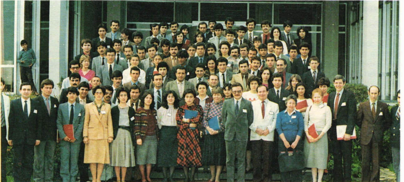
T.C. Turizm Bankası A.Ş. tarafından düzenlenen eğitim programlarından bir tanesi: İngilizce, Almanca, Fransızca, İtalyanca dil kursu, Çeşme...

24.11.1957 tarihinde 2.000.000 TL. sermaye ile kurulan ve Abant Oteli tesislerinin işletmeciliğini ya-