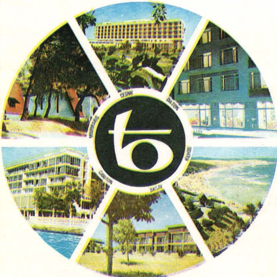
T.C. Turizm Bankası A.Ş.'nin ilk amblemi

Banka, bir taraftan Türkiye'nin yatak kapasitesinin artmasına katkılarını sürdürürken, diğer taraftan özel ve tüzel kişiler tarafından yapılan turizm amaçlı yatırımları, Turizm Bakanlığı'nın politikasına uygun olarak uzun vadeli ve düşük faizli krediler vermek suretiyle teşvik etmiş ve bu yolla da ülkemiz yatak kapasitesinin artmasını destekle-