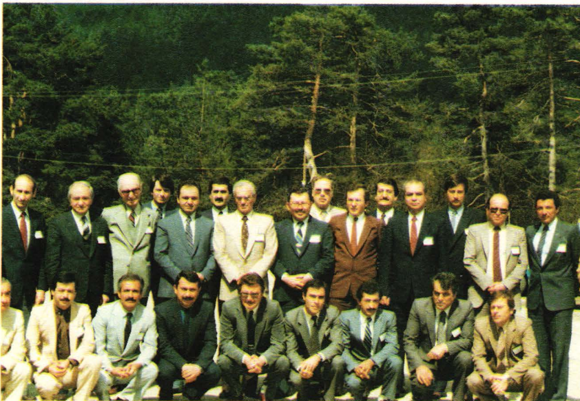
Turban Abant Oteli, (İşletme Müdürleri Kamu Yönetimi ve Halkla İlişkiler Semineri.)

Kayseri İli Özel İdaresi'nden 1991 yılı sonunda kiralanmıştır. 53