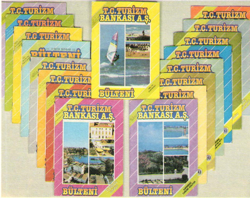
"T.C. Turizm Bankası A.Ş. Bülteni", 1983 - 1988 yılları arasında aralıksız yayınlandı...

kama, 16 adet çamaşır yıkama - ütüleme, 48 adet kiralık buzdolabı ve bay - bayan WC'leri bulunan 2 adet hizmet grubu, market, üç iskele, TV - video seyir mahali, çocuk bahçesi ve otopark bulunmaktadır.