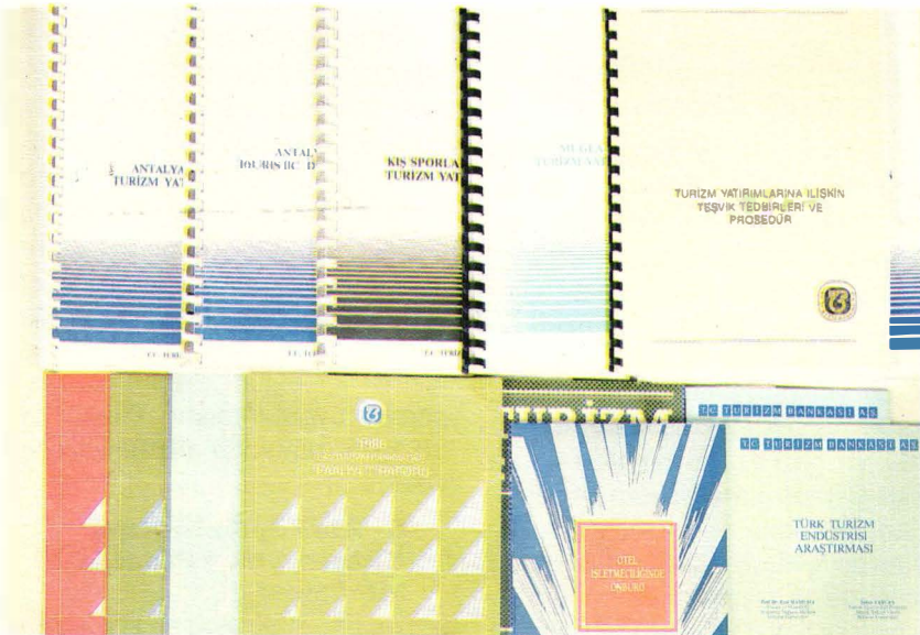
TURBAN tarafından yayınlanan kitaplardan bazıları

İkinci Beş Yıllık Kalkınma Planı'nda; T.C. Turizm Bankası A.Ş.'nin doğrudan işletmecilik yapma-