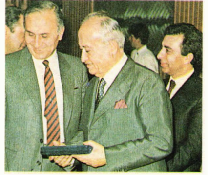
Turizm Bakanları Orhan BİRGİT ve Lütfü TOKOĞLU

Turizm Bakanlığı'nca 1965 yılında yapımına başlanan Marmaris Tatil Köyü, 1971 yılında Banka tarafından tamamlanarak 01. Temmuz 1971 tarihinde hizmete açıl-