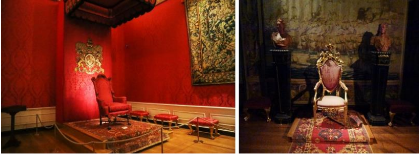
Resim 6. Kensington Sarayı Taht Odalarında Uşak Halısının Kullanımı (URL-4).