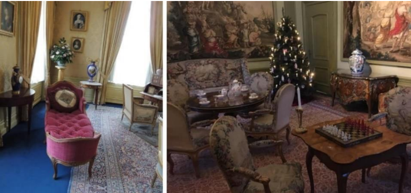
Resim 13. Huis Doorn Sarayı ve Hereke Halısı.