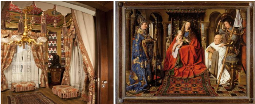
Resim 10. Viktoryan Tarzı Bir Evde ve Jan Van Eyck'in “Paele Madonna” Tablosunda Türk Halısı (URL-6).

Koleksiyonlarda bulunan halılar günümüzde büyük müzelerde sergilenmektedir. Bu koleksiyonlardan biri Arnold Ipolyi'nin Budapeşte Uygulamalı Sanatlar Müzesi’nde yer alan 18 halıdan oluşan koleksiyonudur. Macaristan’da 1914 yılında açılan bir sergide de koleksiyonerlerden toplanan 352 Türk halısı sergilenmiştir (Batari 2006: 444-445). Bu sergideki halı sayısı Türk halısının iç mekânda kullanımının yaygınlığını göstermektedir.