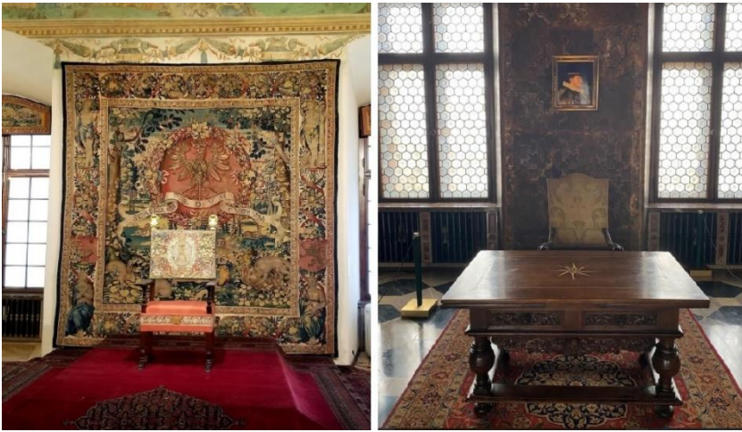
Resim 11. Wavel Şatosu Taht ve Çalışma Odası.

Polonya saraylarında da diplomatik hediye, savaş ganimeti veya ticaretle elde edilen Türk halıları kullanılmıştır. 1585 yılında Polonya Kralı Stefan Batory'nin Ermeni tüccarlardan 26 adet Türk halısı aldığı bilinmektedir (Slota 2006: 453). Çoğunlukla İstanbul'dan getirilen bu halılarla 17. ve 19. yüzyıllar arası süreçte Polonya'da saraylar, zenginlerin evleri, kiliseler dekore edilmekteydi. 19. yüzyılda Türk halısı koleksiyonerleri Polonya'da da ortaya çıkmış, Transilvanya halıları ülkede yaygınlaşmıştır. Kullanılan Türk halıları Krakow Ulusal Müzesi başta olmak üzere çeşitli müzelerde, Barok ve Oryantalist dönem Polonyalı ressamların tablolarında görülebilmektedir. Wavel Şatosu taht ve çalışma odalarında bulunan Türk halısının Polonya'da ürettiği bilinmektedir (Hock vd. 2018) (Resim-11). Böylece, Polonya'da Türk halısının kopya edilerek ürettiği anlaşılmaktadır. Bu örnekte ahşap zeminde taht alanını vurgulayan halı tüm ihtişamıyla duvar halılarını, mekânın mobilya ve dekorasyonunu gölgede bırakmaktadır.