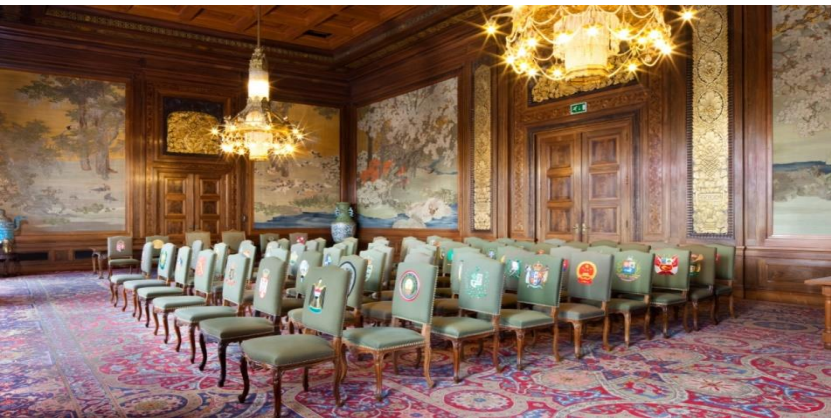
Resim 14. Barış Sarayı Kabul Salonu (URL-8).