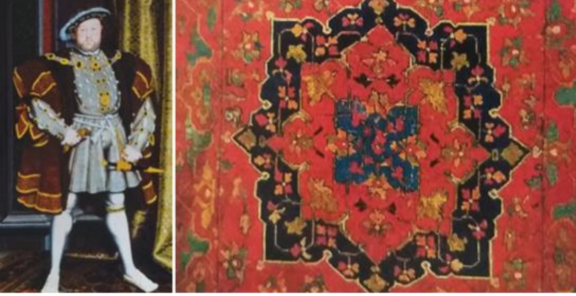
Resim 4. VIII. Henry'nin Yağlı Boya Tablosunda Türk Halısı (Mills, 2006: 652).

tarafından Türk halısından esinlenerek geliştirilen ve İngiliz saraylarında kullanılmış bir halıdır (Jacobs 1970: 13). Günümüzde Buckingham Sarayı'nın halıları Türkiye'de Ak-saray Sultanhanı'nda restore edilmektedir (URL-2). Türk halılarından etkilenecek üretilen bu saray halılarının bakım ve onarımlarının yine Anadolu topraklarında yapılıyor olması ayrıca büyük önem taşımaktadır.