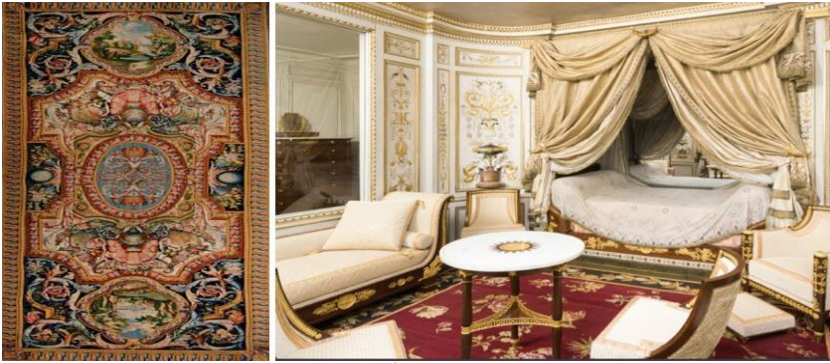
Resim 9. Louvre Sarayı “Büyük Galeri” için Louis Dupont’un Atölyesinde Dokunmuş Bir Savonnerie Halısı (Bremer-David, 2015:35) ve Chateau de Fontainebleau Türk Odasında Savonnerie Halısı (Cochet ve Lebeurre, 2015).

Château De Fontainebleau, Marie Antoinette'nin döneminden günümüze özgün kalan tek mekân olan Türk Odasıyla ünlüdür. Osmanlı figürleri ve motifleriyle süslenmiş mobilyalar, biblolar, kumaşlarla oluşan dekorasyonun renk ve desenle tamamlayıcısı Türk tarzındaki Savonnerie halısıdır (Resim-9). Oda dönemin Turquerie akımını yansıtan önemli bir örnektir.