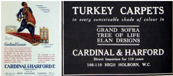
Resim 1. İngiliz Halı Şirketlerinin Reklamları (URL-1).

Bu halılarla lüks ve gösterişli mekân arayışında olan Batılıların kendi zevklerine göre, İngiltere'de çizilen desenler ve hayal ettikleri renklerle eşsiz el sanatı ürünlerine kavuşması söz konusuydu. Batılı şirketlerin halıcılık faaliyetleri Türk sermayedarlarını harekete geçirmiş, 1907'de Uşak Osmanlı Halı Ticarethanesi isimli şirket kurulmuştur (Tutsak 2007:77). Şirket-i Millî adını taşıyan bu fabrika milli sıfatını taşıyan ilk halı üretim örgütlenmesidir.