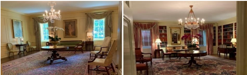
Resim 16. Beyaz Saray Vermeil Odası ve Kütüphanesi (URL-9).