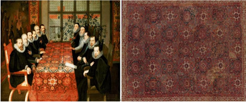
Resim 7. Somerset Sarayı'nda Masa Üzerinde Holbein Halısı (URL-5).

Türk halıları Macar saray ve kiliselerinin dekorasyonunda yüzyıllar süren bir öneme sahip olmuştur. Özellikle 17. yüzyılda Türk halılarının satışı Macaristan pazarında oldukça yaygındı. Bu konuda birçok yazılı örnek mevcuttur.