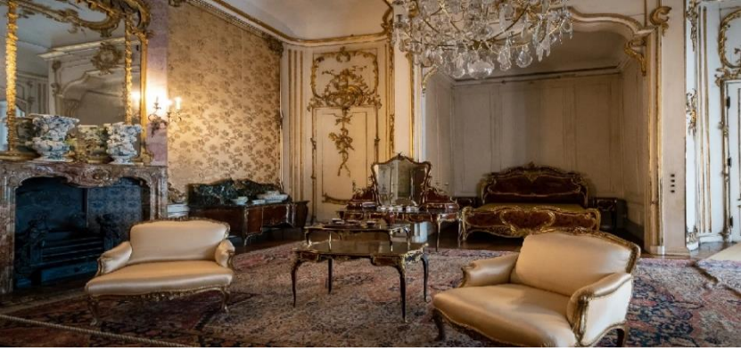
Resim 12. Yeni Saray ve Hereke Halısı.

da dokunmuştur (Resim-14). Dünya siyaseti için önemli bir mekân olan salonda halen Türk halısı ve perdesiyle oluşturulan dekorasyon korunmaktadır.