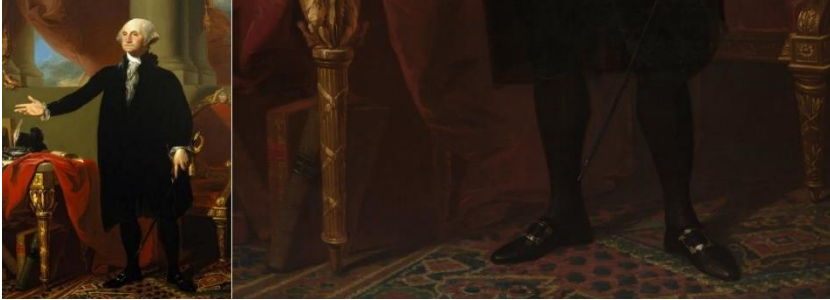
Resim 15. George Washington ve Uşak Halısı (Barratt ve Miles, 2005:45).

Türk halıları diğer Doğu halılarıyla beraber Kanada Toronto'daki soylu ve zenginlerin evlerinde 19. yüzyılda moda olmuştu. Viktoryan tarzı mimarisi ve dekorasyonu evlerin estetik tamamlayıcısı Türk halıları salonlar, yatak odaları ve hollerde kullanılmıştır. O dönemde bir Türk halısına sahip olmanın her Torontolu asilzadenin hayali olduğu kitaplarda yazmaktadır (Brochu 2006: 309). Özellikle tüccar Babayan'ın halı kataloglarından Uşak ve Gördes halıları tercih edilmekteydi. Bu kataloglar beğenilen halıların sadece resimlerini değil; kullanım bilgilerini de içermekteydi. Zamanın gazete ve dergilerinde Türk halılarının reklamları yer almaktaydı.