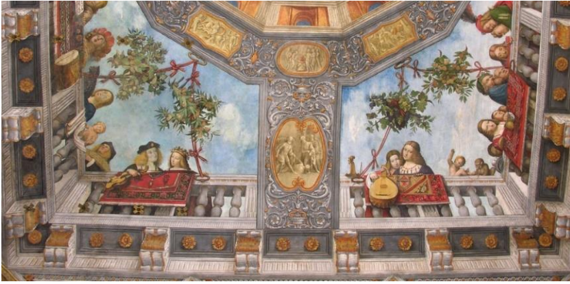
Resim 3. Costabili Sarayı Fresklerinde Anadolu Halıları (Suriano, 1996: 51).

Bilhassa İtalya’da sarayların veya evlerin balkonlarından Türk halısı sarkıtmak zenginlik ve asaletin sembolü sayıldığından parası olmayanların halıları kiraladıkları bilinmektedir (Rosamond 2005: 125).