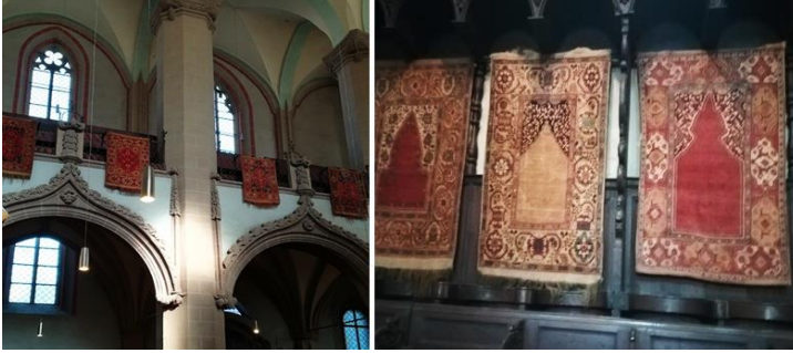
Resim 8. Kara Kilise’de Türk Halıları.

edilmişlerdir. Zamanla bu halıların pastel renkleri, çiçek veya karmaşık geometrik motifleri kiliseler için prestijli bir dekorasyon haline gelmiştir (Resim- 8).