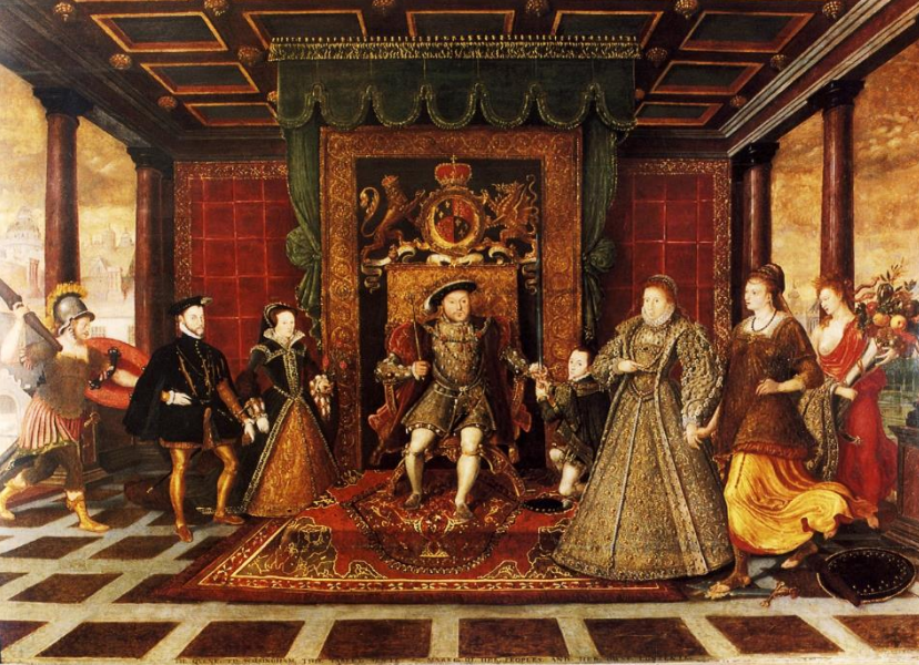
Resim 5. Lukas de Heere Tarafından Yapılan Tabloda Uşak Halısı (URL-3).