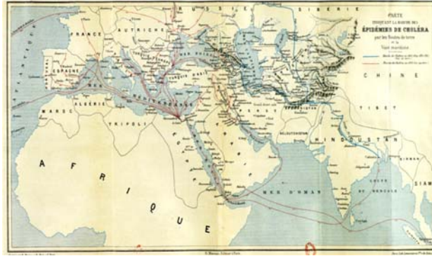
Harita 1: Koleranın Yayılma Yollarını Gösteren Harita-1 15

Kolera, tıpkı insanlar gibi, ana yollardan geçerek kasabadan kasabaya atlamış, öncelikle nüfusun en yoğun olduğu, ticaretin geliştiği yerleri vurmuştur. Nitekim XIX. yüzyıl boyunca Batı’ya ulaşmak için üç ana yolu kullanmıştır. Birincisi; Hindistan’dan başlayıp, Afganistan, İran, Hazar Denizi sahilleriyle Rusya’ya ve Karadeniz kıyılarına ulaşan karayolu; ikincisi, Hindistan’dan Umman Denizi, Basra Körfezi sahillerinden içeriye Bağdat ve çevresinden geçen deniz ve karayolları; üçüncüsü, Hindistan’dan Kızıldeniz boyunca Cidde ve İskenderiye gibi limanlara uğrayan deniz yoludur. 14