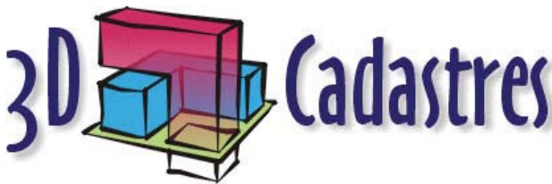
Şekil 1. 3B kadastro lar çalışma grubu logosu

2002 yılında 3B kadastro lar Çalışma Grubunun kurulmasından sonra 2010 yılına kadar FIG'in düzenli olarak her yıl gerçekleştirdiği çalışma haftası toplantılarında ve dört yılda bir düzenlediği kongrelerde 3B kadastro isimli oturumlar düzenlenerek farklı ülkelerden katılımcıların sunum yapımları sağlanmıştır. Ancak, 2006-2010 yılları arasında çalışma grubunun FIG bünyesinde faaliyeti olmamıştır. 3B kadastro çalışmaları üzerinde daha fazla ilerleme sağlamak amacıyla 2010 yılının Nisan ayında Sydney'de gerçekleştirilen FIG kongresinde 2010-2014 yılları arasında faaliyet gösterecek '3B Kadastro lar' isimli bir çalışma grubunun yeniden oluşturulmasına karar verilmiştir. Şekil 1'de FIG bünyesinde kurulan 3B kadastro lar çalışma grubunun logosu görülmektedir (URL-1).