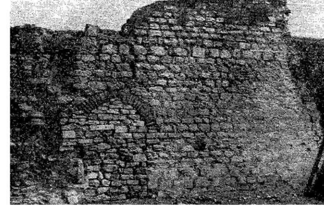
Resim : 1, Fatih Darüşşifasından bir duvar harâbesi (1947)

yaptırılan mescid bu yangında ikinci defa harap olarak yıkılmış 54 ve adı, o sıralarda henüz esas Darüşşifa binâsından ayrılan mescide verilerek, Çırçır yangınına kadar bu şekilde gelmiştir. Evvelce zikredilen H. 1254 (1838) tarihli İstanbul camileri haritasında hakikî Demirciler mescidi gösterilmemiştir. Darüşşifaya en yakın mevkilerde işaret edilen mescidler arasında, bilhassa iki tanesi vardır ki, Sankiyedim ve Kepenekçi Ali Çelebi mescidleri adlarını taşıyan bu mâbedleri şimdiki halde Hadika da bulmak mümkün olmamıştır 55 . Hakıyki Demirciler mescidinin tamamen kaybolmuş olabileceği gibi, her hangi bir sebep ile adının değişerek Fatih ve Çırçır yangınlarına kadar gelmesine de ihtimal verilebilir. Fakat şimdiki halde Demirciler mescidinin, Kepenkçi veya Sankiyedim mescidlerinden biri ile aynı bina olduğuna hüküm verebilmek imkânsızdır. Bu mes'eleyi aydınlatmak için önce, Fatih ve Çırçır yangınlarının alt-üst ettiği bu semtteki abideler hakkında küçük monografyaların hazırlanması daha doğru olur.