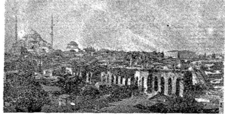
1. Şehzade cami'i minaresinden çekilen ve Fatih cami'ini gösteren eski bir fotoğraf. (G. Schlumberger, Épopée byzantine , II, s. 601 den.)