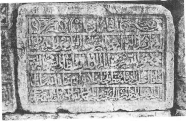
Resim 2 — Gümenek Gazan Han Kitâbesi