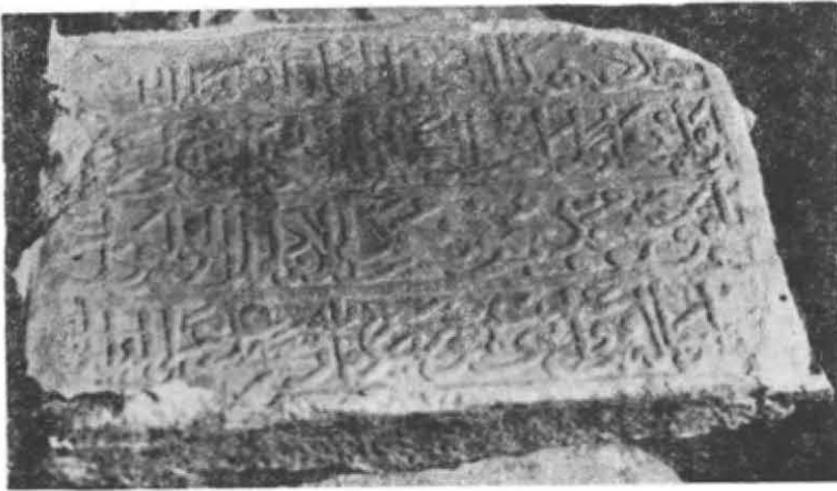
Resim 3 — Palas Köyü Çeşme Kitâbesi