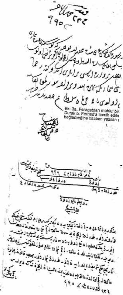
Ek: 3a. Feragatdan mahul bir Durak b. Ferhad'a tevcih edilen beglerbeğine hitaben yazılan :

Ek 3b: Durak b. Ferhad'ın 14.M.996 tarihinde Ruznâmçeye kaydedilen timâr tezkeresi. (Ruznâmçe 97, s. 116/2). Ek. 3a'da ki arz üzerindeki "kayd-şod" tarihi ile tezkerenin verilîş tarihinin aynı olduğu görülmektedir.