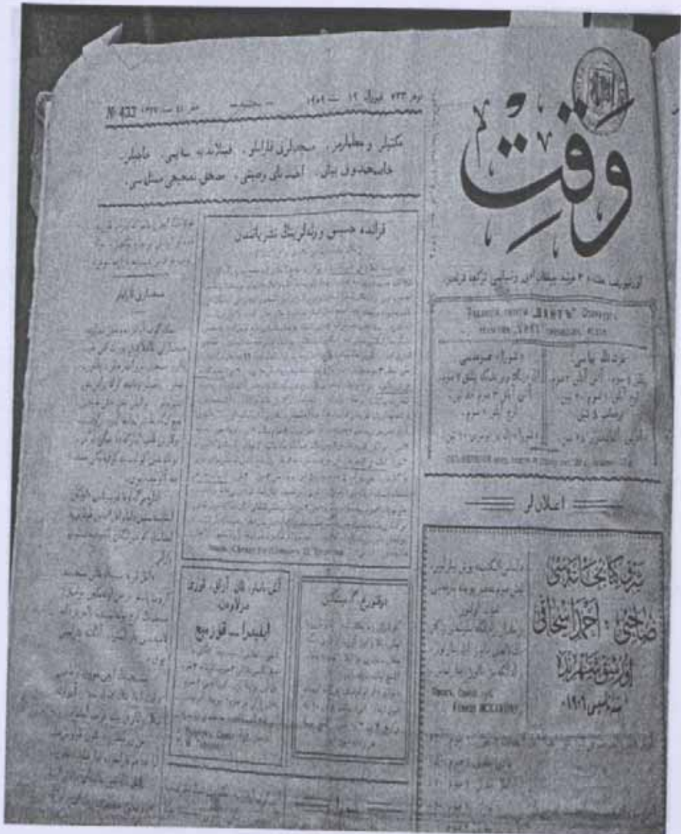
Vakit, Orenburg, 1908-1918.