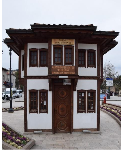
Foto 22. Turizm Danışma Bürosu, 2013

Bunun sonucu olarak cepheye hâkim geleneksel doku iç mekâna da yansımıştır. Ahşap tavan üzerindeki ahşap tavan göbeği kare bir çerçeve içine applike edilen bitkisel motiflerle doldurulmuştur. Bu teknikle yapılan tavan göbekleri geleneksel konut mimarisine öykünmenin iç mekândaki güçlü bir uygulamasıdır (Foto.23).