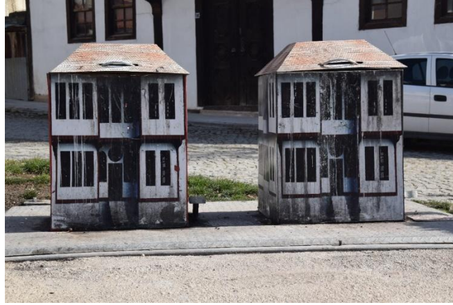
Foto 32. Çöp Kutuları

Bu dekoratif işlevsel belediye çöp konteynırları farklı bir uygulama ile ele almıştır. Yerin belli bir derinliğine kadar kazılmasıyla elde edilen çöp toplama yerlerinin hemen üstü tarihi evlerin birer minyatür biçimindeki uygulaması şeklinde yapılmıştır. Bu örnek, tarihi dokunun etkilerinin çevre düzenlemelerinde çok farklı noktalarda nasıl ortaya çıkabileceğini göstermesi bakımından dikkat çekicidir (Foto.32).