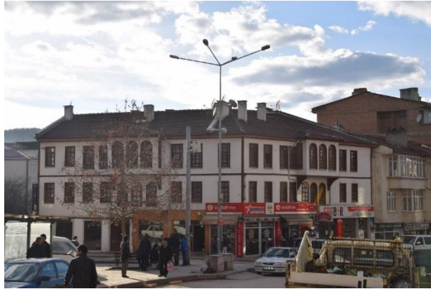
Foto 4. Keskin Apartmanı, 2005

Kentin sit alanı içinde bulunan ve geleneksel mimarinin özelliklerini yoğun bir biçimde yansıtan yapılardan birisi ise Cebrazil mahallesinde görülen Keskin apartmanıdır. Apartman 2005 yılında aynı parselde yıkık bir şekilde bulunan tarihi bir yapının yerine Ankara Kültür ve Tabiat Varlıklarını Koruma Kurulu onayıyla inşa edilmiştir. 1 Üç katlı yapının zemin katı dükkân olarak kullanılmaktadır. 'L' planı şeklinde yolun biçimine göre tasarlanan yapının her iki cephesinde de üçüncü katın ortasında ahşap destekler üzerine oturan birer orta çıkma bulunmaktadır. Bu çıkma ve ahşap çerçeveli dikdörtgen pencereler geleneksel konut mimarisinin bir yansımasıdır. Yapının cephelerinde ve cephelerin kesişen noktalarındaki yatay/dikey yönde uzayan ahşap şeritlerle bir bütünlük oluşturan renk dokusu ile kiremit kaplı kırma çatısında güçlü bir geleneksel mimariye öykünme görülür (Foto.4) Yapının iç mekânına hâkim anlayış tamamen modernidir.