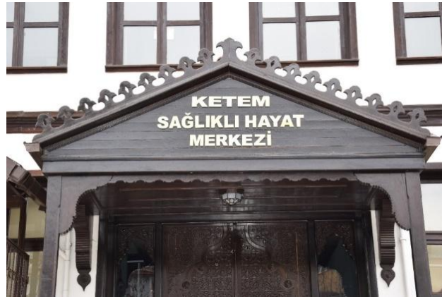
Foto 20. Ketem Verem Savaş Dispanseri, giriş kapısı detayı

Yapının üçgen alınlıklı giriş kapısı üzerindeki kırma çatının önünde yer alan palmet motifleri ve kapının üzerindeki geometrik desenli süslemeler Selçuklu ve devamında Osmanlı sanatlarında da görülmektedir. Böylece yapıda geleneksel mimariye yönelik atıflar birden çok özellikle ele alınmıştır (Foto.20). Binanın iç mimarisinde tamamen modern yaklaşımlar görülmektedir.