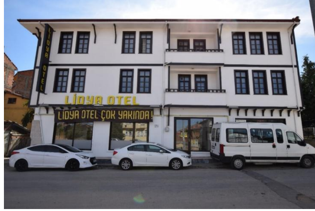
Foto 31. Lidya Otel, 2018