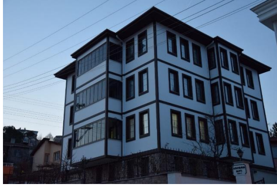
Foto 14. Safran Apartmanı , yan ve arka cephesi