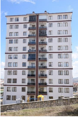
Foto 11. Gölpark Kuzey Kale Apartmanı, 2018

sayılarının da arttığı görülmektedir. Geleneksel yaklaşımlar tamamen modern yapı malzemeleri ile ele alınmasına karşın bazı yapılarda geleneksel mimarinin etkileri sınırlı olsa da görülmektedir. Kuzeykent bölgesi civarında geleneksel yaklaşımla inşa edilen apartmanların sayısı diğer modern yerleşim yerlerinde inşa edilen geleneksel etkideki apartmanlara göre fazladır. Ancak çok katlı modern apartmanlarda geleneksel konut mimarisine öykünme yalnızca cephelerindeki renk dokusunda görülür. Bunun dışında bütünüyle modern mimarlık yaklaşımlarına sahip apartmanlardan hiçbir farkları yoktur. Gölpark Kuzey Kale ve Egemen Apartmanlarında çok katlı olarak inşa edilen betonarme karkas cephelerinde, katların arasında bulunan yatay şeritler ve yapının köşelerinde bulunan dikey şeritler geleneksel malzeme yerine boya ile tasarlanarak yapıya uygulanmıştır. Yapının beyaz zemini üzerinde zıtlık oluşturan bu şeritler geleneksel mimariye öykünmeyi son derece sınırlı düzeyde çizgisel bir şekilde yansıtır. İç mekânda ise geleneksel mimariye öykünme her iki yapıda da görülmez (Foto.11, 12).