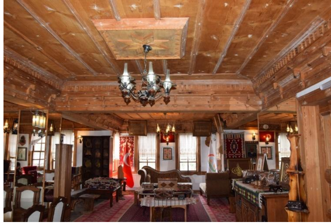
Foto 25. El Sanatları Eğitim Merkezi Müdürlüğü, iç mekân

İç mekânda ise geleneksel mimariye güçlü bir öykünme içerir. Ahşap tavan ve tavan göbeği süslemesi, ahşap kirişler ve iç mekândaki geleneksel günlük kullanım eşyaları yapının geleneksel dokunun yalnızca dış cephede değil yapının bütününde uygulandığını göstermesi bakımından dikkat çekicidir (Foto.25).