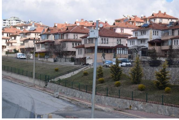
Foto 15. Sancak Sitesi , genel görünüm, 2004-2008

Kastamonu'da geleneksel mimariden etkilenen diğer bir yapı türü ise villa tipi sitelerde görülen yaklaşımlardır. Bu tür konutlar genellikle iki dairenin yan yana sıralanmasıyla oluşturulmuşlardır. Kentte geleneksel dokudan etkilenen villa tipi evler oldukça azdır. Kuzeykent mahallesindeki Sancak Sitesi evleri ( 2004-2008) bu tür yapı grubunda yer almaktadır. Site toplam 28 bloktan oluşmaktadır (Foto.15).