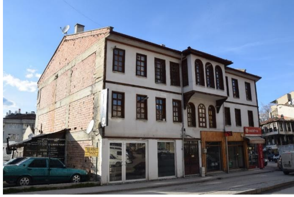
Foto 5. Keskin Apartmanı, tuğla ile örülen yan cephe detayı

Keskin apartmanında görülen mimari uygulamalar ve yaklaşım biçimlerinin bir benzeri de Kırıkoğlu apartmanında görülür. Yapı betonarme karkas malzemeden yapılmış olup üç katlıdır. Yapının zemin katı ticaret amaçlı kullanılmaktadır. Yapının ön cephesindeki yatay ve dikey şeritler, ahşap çerçeveli pencereler ve geniş saçaklı çatı geleneksel mimarinin birer yansımalarıdır (Foto.6)