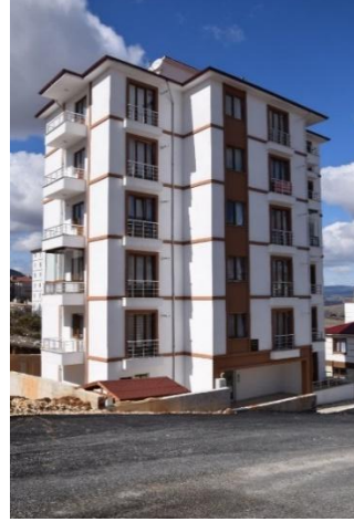
Foto 12. Egemen Apartmanı, 2018

Yine Kuzeykent'te bulunan Safran Apartmanında ise geleneksel dokuya atıf oldukça güçlüdür. Dört katlı olarak inşa edilen yapının kahverengi pimapepli pencere çerçevelerinde uygulanan renk, cephenin yatay ve dikey şeritler ile bütünlük oluşturularak geleneksel dokuya atıf yapılmıştır. Yapının ortasında iki kat boyunca yükselen çıkma biçimindeki balkonları ise geleneksel mimarideki biçimleri farklı bir yorumla ele alarak cepheyi yumuşatmıştır (Foto.13)