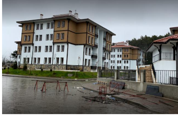
Foto 17. İhsangazi TOKİ Konut Sitesi, 2016-2017