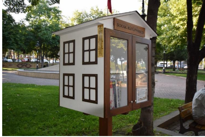
Foto 33. Sokak Kütüphanesi

Sokak kütüphanesi gibi tasarlanan diğer bir dekoratif öge ise parkların içinde bulunan kuş evleridir. Yüksek tutulan demir direk üzerinde aynı malzemeden dekoratif kuş evleri yapılmıştır. Bu evler üçgen alınlıkları ve renk dokusu ile kentin tarihi mimarisini yansıtmaktadırlar (Foto.34).