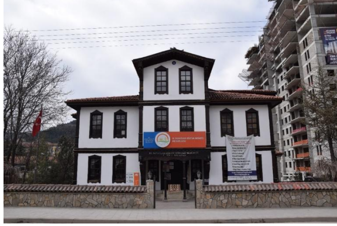
Foto 24. El Sanatları Eğitim Merkezi Müdürlüğü, 2000

İç mekânda ise geleneksel mimariye güçlü bir öykünme içerir. Ahşap tavan ve tavan göbeği süslemesi, ahşap kirişler ve iç mekândaki geleneksel günlük kullanım eşyaları yapının geleneksel dokunun yalnızca dış cephede değil yapının bütününde uygulandığını göstermesi bakımından dikkat çekicidir (Foto.25).