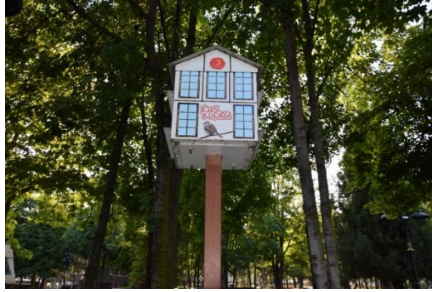
Foto 34. Kuş Evi

Sokak kütüphanesi gibi tasarlanan diğer bir dekoratif öge ise parkların içinde bulunan kuş evleridir. Yüksek tutulan demir direk üzerinde aynı malzemeden dekoratif kuş evleri yapılmıştır. Bu evler üçgen alınlıkları ve renk dokusu ile kentin tarihi mimarisini yansıtmaktadırlar (Foto.34).