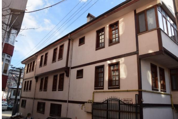
Foto 7. Kırıkoğlu Apartmanı, arka cephesi

Keskin apartmanında yalnızca ön cephelerde yoğunlaşan geleneksel yaklaşım, benzer amaçla inşa edilen Kırıkoğlu apartmanının tüm cephelerinde uygulanmıştır. Özellikle arka cephedeki ikili ve üçlü pencere düzeni ve ahşap çerçeveler geleneksel konut mimarisinin birer yansımasıdır (Foto.7). Apartmanın içinde ise geleneksel mimariye öykünme yoktur.