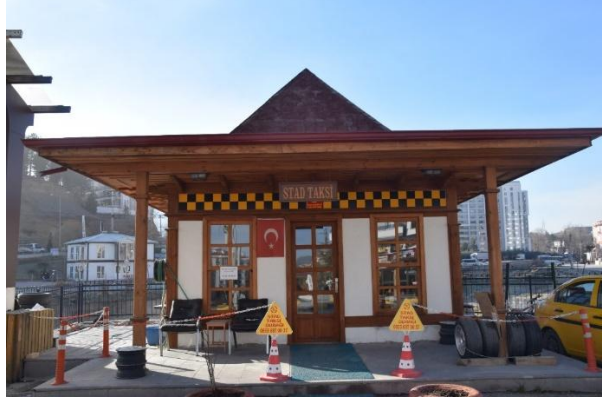
Foto 27. Stad Taksi Durağı, 2019

Kastamonu Belediyesinin kent dokusunu iyileştirme projeleri içindeki modern taksi durakları gibi yapıların tarihi dokuyu anımsatması düşüncesi ile yeni inşa edilen taksi duraklarında da geleneksel mimariye öykünme görülür. Taksi durakları, cephelerinde tasarım olarak bazı farklılıklara sahip olsalar da genel olarak tarihi kent mimarisini yansıtan minimal yapılar olarak karşımıza çıkmaktadırlar (Foto.27).