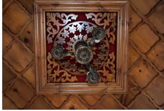
Foto 23. Turizm Danışma Bürosu, tavan göbeği

Bunun sonucu olarak cepheye hâkim geleneksel doku iç mekâna da yansımıştır. Ahşap tavan üzerindeki ahşap tavan göbeği kare bir çerçeve içine applike edilen bitkisel motiflerle doldurulmuştur. Bu teknikle yapılan tavan göbekleri geleneksel konut mimarisine öykünmenin iç mekândaki güçlü bir uygulamasıdır (Foto.23).