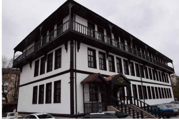
Foto 19. Ketem Verem Savaş Dispanseri, 2019

Geleneksel mimariden etkilenecek inşa edilen yapılardan ilki, sit alanı içinde bulunan Ketem Verem Savaş Dispanseri'dir. 1936 tarihinde tek katlı olarak inşa edilen yapı 1970 yılında yeniden inşa edilmiştir. Bu kez iki katlı olarak inşa edilen yapı, 2000 yılında İl Sağlık Müdürlüğü hizmet binası, günümüzde ise Ketem Verem Savaş Dispanseri olarak kullanılmaktadır. 2 Yapı günümüzde zemin üzerine iki katlıdır. İnşasında betonarme karkas malzemenin kullanıldığı binanın cephelerinde tarihi Kastamonu mimarisini andıran yapı malzemesi kullanımı söz konusudur. Koyu kahve ahşap rengi ile düz lentolu sade dikdörtgen pencerelerin yapıdaki kullanımı, zemin ile birinci katı yatay biçimde kesen koyu renkteki ahşap şerit, köşelerdeki dikey şeritler, geniş saçaklı ahşap destekler üzerine oturan ahşap çatısı ile tarihi Kastamonu evlerinin cephe dokusu güçlü bir şekilde vurgulanmıştır (Foto.19).