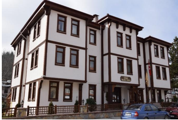
Foto 28. Hisar Talebe Yurdu, 2013-2015

Hisarardı Mahallesinde bulunan Özel Hisar Talebe Yurdu da benzer bir yaklaşıma sahiptir. Dört katlı betonarme yapının cephelerindeki çıkmalar, dikey, yatay şeritler, çatı ve çıkmaların altındaki destek öğeleri ile bütünleşen renk dokusu geleneksel mimariyi andırmaktadır (Foto.28).