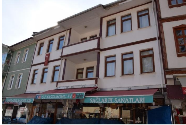
Foto 2. İlhan Sağlar Apartmanı, 2005

Hatice Topaloğlu apartmanı bitişiğinde bulunan İlhan Sağlar apartmanı da benzer bir düşünce ile ele alınmıştır. Üç katlı olan yapının zemin katı dükkân olarak kullanılırken diğer katlar ailelerin barınma ihtiyacını gideren dairelere bölünmüşlerdir. Betonarme malzemenin kullanıldığı yapının katları arasında görülen yatay şeritlerde ahşap malzeme yerine boya kullanılırken geleneksel mimaride görülen ahşap şeritlerin modern bir yaklaşımla ele alındığı görülmektedir. Yalın ve sade dikdörtgen pencerelerde modern bir anlayış görülse de yan yana üçlü pencere düzeni Kastamonu konut mimarisinin pencere düzenine öykünme içerir (Foto.2)