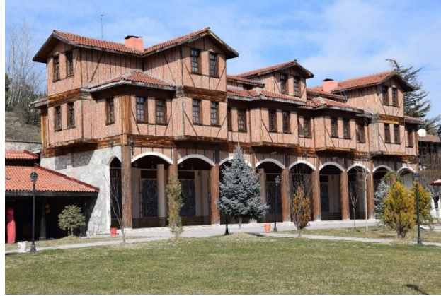
Foto 30. Serender Otel, 2004-2006

İş merkezleri dışında inşa edilen diğer ticaret yapıları da otellerdir. Kentte çok sayıda otel bulunmaktadır. Otellerin büyük bir bölümü orijinalde tarihi bir konak iken; restore edilerek ticari amaçla kullanılan yapılara dönüştürülmüştür. Bunların dışında tarihi Kastamonu konaklarına öykünülerek otel olarak kullanılmak amacıyla inşa edilen modern yapılar da bulunmaktadır. Bunlardan biri 2004 yılında üç katlı olarak inşa edilen Serender Otel'dir. Otelin zemin kat giriş bölümü ahşap sütunlar üzerine oturmaktadır. Diğer kısımlarda ise taş malzeme kullanımı görülmektedir. Yapının ikinci ve üçüncü katlarında ahşap ve tuğla kullanımı görülmektedir. Bu katlarda geleneksel yapım tekniklerinin de kullanıldığı görülmektedir. Yapının ön cephesinde bulunan kırma çatılı çıkmalar geleneksel Kastamonu evlerinin bir yansımasıdır. Yapının planlanmasında modern tasarımlara bağlılık görülse de iç mekân dekorasyonunda, özellikle ahşap tavan ve süslemeleri geleneksel mimariye öykünme içerir (Foto.30).