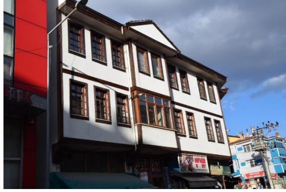
Foto 6. Kırıkoğlu Apartmanı, 2005

Keskin apartmanında görülen mimari uygulamalar ve yaklaşım biçimlerinin bir benzeri de Kırıkoğlu apartmanında görülür. Yapı betonarme karkas malzemeden yapılmış olup üç katlıdır. Yapının zemin katı ticaret amaçlı kullanılmaktadır. Yapının ön cephesindeki yatay ve dikey şeritler, ahşap çerçeveli pencereler ve geniş saçaklı çatı geleneksel mimarinin birer yansımalarıdır (Foto.6)