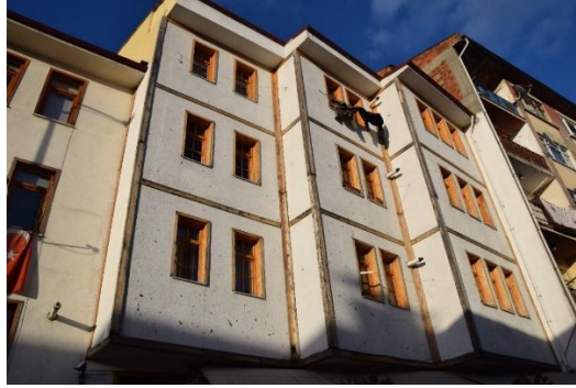
Foto 9. Zincirlioğlu Apartmanı, detayı

Bulunduğu arazinin koşullarına göre şekillenen ve kot farkından dolayı kademeli bir şekilde uzanan yapının ikinci kademesindeki dikey ve yatay ahşap şeritler geleneksel dokuya atıf içeren bir diğer unsurlardır (Foto.9). Bunun dışında yapının iç mekânında geleneksel dokuya öykünme görülmez.