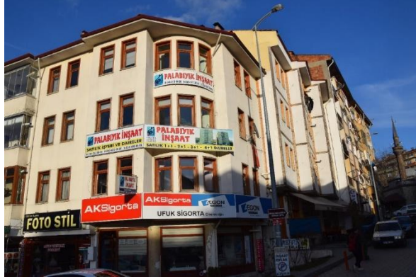
Foto 8. Zincirlioğlu Apartmanı, 2017

ayrılmıştır. 'L' biçiminde tasarlanan yapının geniş saçaklı çatısı ile ahşap çerçevelere sahip yalın dikdörtgen pencereleri cephelerdeki geleneksel yaklaşımı yansıtmaktadır (Foto.8).