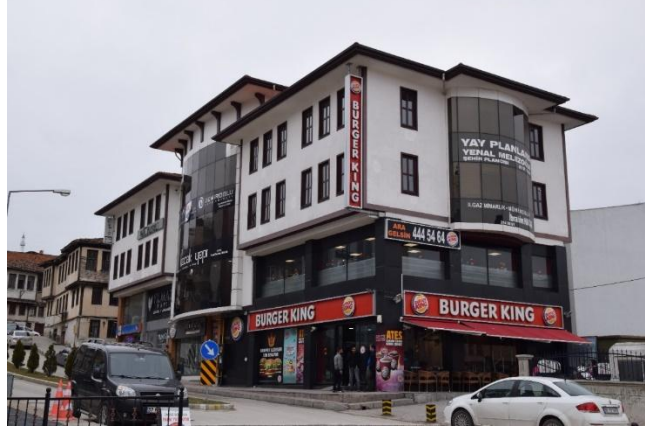
Foto 29. Urganoğlu İş Merkezi, 2015

2015 yılında inşa edilen Urganoğlu İş Merkezi, betonarme ve cam malzemenin yoğun kullanıldığı bir yapıdır. Dört katlı olarak inşa edilen yapının ilk iki katı çeşitli iş yerleri tarafından kullanılmaktadır. Üçüncü ve dördüncü katlarında geleneksel dokuya öykünme dikey ve yatay kahverengi şeritlerde, pencere çerçevelerinde ve geniş saçaklarda görülmektedir. Orta bölüm, yanlardan daha yüksek tutulmuş ve bu bölümün çatısı geleneksel konutlardaki uygulamalara benzer şekilde ahşap desteklere oturtulmuştur. Bu uygulama taşıyıcı nitelikte olmayıp dekoratif bir uygulama olarak değerlendirilmiştir. Yapının iç mekânında ise geleneksel mimariye öykünme görülmemektedir (Foto.29).