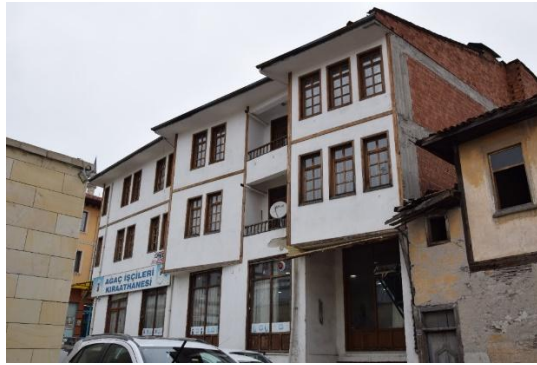
Foto 10. Alikamanoğlu Apartmanı, 2019

Sit alanı içinde inşa edilen ve Keskin apartmanına benzer bir yaklaşımı gösteren diğer bir yapı ise Hepkebirler Mahallesi'ndeki Akikamanoğlu apartmanıdır. Betonarme karkas malzemeyle yapılan apartman üç katlı olarak inşa edilmiş ve zemin katı çeşitli işlevlerdeki dükkanlar için ayrılmıştır. İkili ve üçlü pencere düzeninin yanı sıra geniş saçaklı betonarme çatısı ve ikinci kattan itibaren yükselen çıkmalar geleneksel yaklaşımlara öykünme içerirken, yatay ve dikey ahşap şeritler geleneksel mimarinin cepheye güçlü bir şekilde taşınmasını sağlamıştır. Zincirlioğlu apartmanında geleneksel mimariye öykünme ön cephe ile sınırlı kalmıştır (Foto.10).