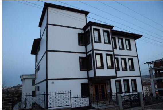
Foto 13. Safran Apartmanı, ön cephe, 2017

Yine Kuzeykent'te bulunan Safran Apartmanında ise geleneksel dokuya atıf oldukça güçlüdür. Dört katlı olarak inşa edilen yapının kahverengi pimapepli pencere çerçevelerinde uygulanan renk, cephenin yatay ve dikey şeritler ile bütünlük oluşturularak geleneksel dokuya atıf yapılmıştır. Yapının ortasında iki kat boyunca yükselen çıkma biçimindeki balkonları ise geleneksel mimarideki biçimleri farklı bir yorumla ele alarak cepheyi yumuşatmıştır (Foto.13)