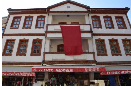
Foto 1. Hatice Topaloğlu Apartmanı, 2000

Hatice Topaloğlu apartmanı bitişiğinde bulunan İlhan Sağlar apartmanı da benzer bir düşünce ile ele alınmıştır. Üç katlı olan yapının zemin katı dükkân olarak kullanılırken diğer katlar ailelerin barınma ihtiyacını gideren dairelere bölünmüşlerdir. Betonarme malzemenin kullanıldığı yapının katları arasında görülen yatay şeritlerde ahşap malzeme yerine boya kullanılırken geleneksel mimaride görülen ahşap şeritlerin modern bir yaklaşımla ele alındığı görülmektedir. Yalın ve sade dikdörtgen pencerelerde modern bir anlayış görülse de yan yana üçlü pencere düzeni Kastamonu konut mimarisinin pencere düzenine öykünme içerir (Foto.2)