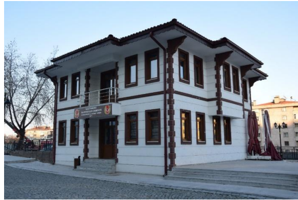
Foto 26. Gazeteciler Cemiyeti, 2017

Kastamonu Belediyesine ait diğer bir yapı ise Kastamonu Gazeteciler Cemiyeti'dir. İki katlı betonarme karkas yapının cephelerindeki ahşap silmeler, pencere çerçevelerindeki renk dokusu, geniş saçaklı betonarme çatısı ve dört cephedeki çıkmalar ile tarihi Kastamonu evlerinin biçimsel özelliklerini yansıtmaktadır. Yapının iç mekân tasarımı ise tamamen modern yaklaşımlarla ele alınmıştır (Foto.26).