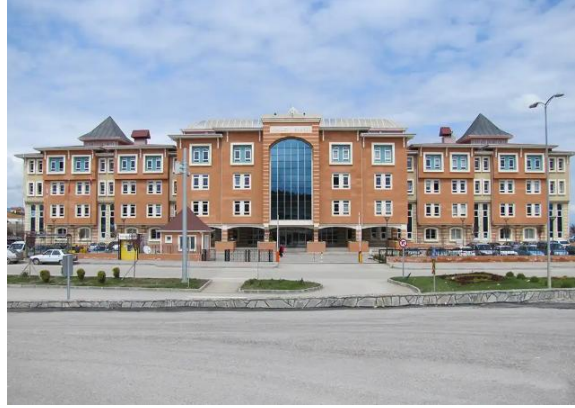
Foto 21. Kastamonu Adalet Sarayı 5 , 2008

25 Haziran 1992 tarihindeki 204/8 sayılı KHK kararı ile başta Adalet Sarayları olmak üzere inşa edilecek bazı kamu yapılarının çağın gelişmelerine uygun şekilde geleneksel ve modern Türk mimarisine uygun bir şekilde tasarlanacakları belirtilmektedir. 3 Yine 2018 yılındaki Cumhurbaşkanlığı Seçimleri ve Genel Seçimlerdeki Beyannamelerinde Selçuklu ve Osmanlı mimarisini öne çıkaran yapıların inşasından da söz edilmektedir. 4 Bu kararların bir sonucu olarak bir çok ilde inşa edilen Adalet Sarayları'nda Selçuklu, Osmanlı ve bazen de yöresel mimariye öykünme bir arada görülmektedir. Kastamonu'da inşa edilen Adalet Sarayı bu bağlamda inşa edilmiştir (Foto.21).