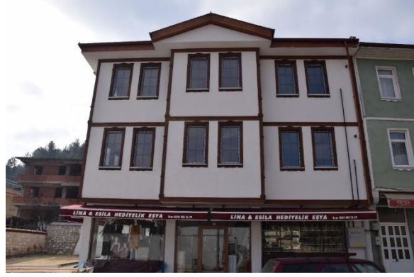
Foto 3. Ahmet Yahyaoğlu Apartmanı, 2018

Kentin sit alanı içinde bulunan ve geleneksel mimarinin özelliklerini yoğun bir biçimde yansıtan yapılardan birisi ise Cebrazil mahallesinde görülen Keskin apartmanıdır. Apartman 2005 yılında aynı parselde yıkık bir şekilde bulunan tarihi bir yapının yerine Ankara Kültür ve Tabiat Varlıklarını Koruma Kurulu onayıyla inşa edilmiştir. 1 Üç katlı yapının zemin katı dükkân olarak kullanılmaktadır. 'L' planı şeklinde yolun biçimine göre tasarlanan yapının her iki cephesinde de üçüncü katın ortasında ahşap destekler üzerine oturan birer orta çıkma bulunmaktadır. Bu çıkma ve ahşap çerçeveli dikdörtgen pencereler geleneksel konut mimarisinin bir yansımasıdır. Yapının cephelerinde ve cephelerin kesişen noktalarındaki yatay/dikey yönde uzayan ahşap şeritlerle bir bütünlük oluşturan renk dokusu ile kiremit kaplı kırma çatısında güçlü bir geleneksel mimariye öykünme görülür (Foto.4) Yapının iç mekânına hâkim anlayış tamamen modernidir.