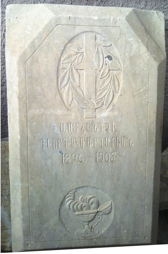
Resim 2: Afyonkarahisar Müzesindeki Ermenice Mezartaşları