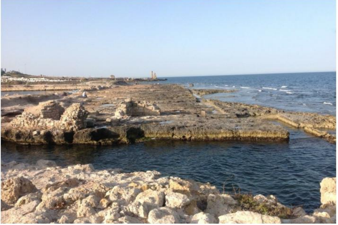
Resim 1: Mehdiye Limanı girişi ve kalıntıları.