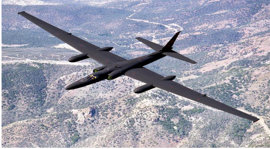
Resim 2: U-2: ABD gözetleme ve casus uçağı