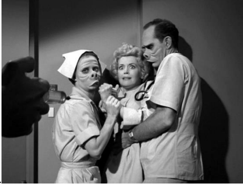
Resim 5: Alacakaranlık Kuşağı, 'Bakanın Gözleri' (Eye Of The Beholder), 1960.

değildir. Kullanması gereken akla ve vicdana sahiptir. Kişilerin, istenilen biçimde yontulabilecek seyirlik bir obje olarak algılanıp güzel ve çirkin nitelendirmeleri ile gruplandırılmamaları önemlidir. Kişilerin nitelikleri iyi ve kötü yargıları çerçevesinde biçimlenmelidir. Yani insanın herhangi bir canlıya bakışı aklın ışığında ahlaki bir bakmadan ileri gelmelidir.