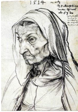
Resim 2: Albrecht Dürer, Annesinin Portresi, Kağıt Üzerine Siyah Tebeşir, 1514, Staatliche Müzesi, Berlin

Albrecht Dürer'in 1514 yılında annesini çizdiği deseninde ( Resim 2); kadın figürü kırışmış cildi, büyük burnu ve orantısız gözleri ile güzel bir kadın imgesinden uzak bir tasvirdir. Fakat Dürer'i annesini çizmeye iten neden muhtemelen annesine karşı duyduğu sevgi ve minnet duygusudur (Gombrich, 2011: 17). Çizgisel güzelliğin dışında annenin yorgun yüzünden etkilenmemek mümkün görünmemektedir. Güzele bakma tutkumuzu anlamsız kılan ressam, annesine hissettiği duyguları bizimde hissetmemizi istemesi insana ait her meseleyi konu edinebilen sanatın içeriğini genişletmekte ve değerini arttırmaktadır.