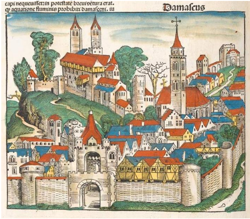
Gravür 1: 15. yüzyılda Şam Şehri, (Schedel, H.& Wolgemut, M. 1493: XXIII)