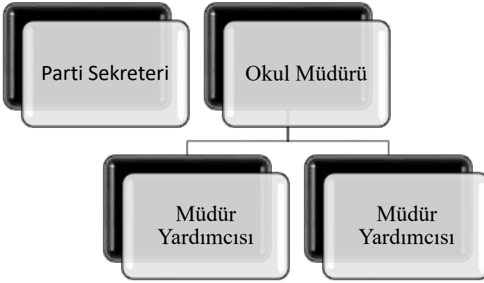
Şekil 3. Çin Eğitim Sistemi’nde Okul Yönetimi Yapılanması (Kaynak: Bakioğlu ve Özcan, 2014’ten uyarlanmıştır.)

Çin’de okullarda eğitim Devlet Konseyi tarafından çok yakından parti sekreterleri aracılığıyla takip edilmektedir. Çin okullarının yönetiminde okul müdürü okulun genel idaresinden sorumludur. Yetki ve sorumluluklarını müdür yardımcıları ve bölüm başkanlarıyla paylaşır (Bakioğlu ve Özcan, 2014). Okul yönetimi yapılanması Şekil 3’te verilmiştir.