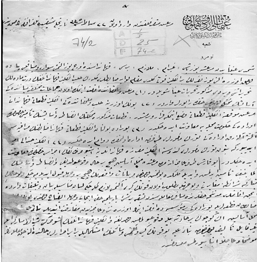
Ek 1. İngilizlerin, Maraş'ı işgal ettikten sonra Maraş Mutasarrıfına Verdikleri Halep İngiliz Kumandanlığı'nın 4 maddelik yazısı (ATASE, İSH, A:1/3, D:25, F:74-2).