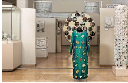
Resim 15. Sergi mekânının genel görüntüsü