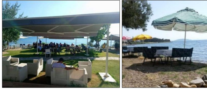
Foto 4. Sahildeki Cafe ve Çay Bahçesi Tarzı Rekreasyonel Alanlar

Dışarıya gidip bir çay bahçesinde oturacağı en yakın yer İskele (İskele Mahallesi). Orası buraya göre çok çok iyi. ...Buradaki profil başka. Mesela şimdi gençler akşam yapacak hiçbir şey yok. Eğlenmeye İskele'de de bir şey yok onlar adına. En şeyi var, Ören, sahil kesimi olan. Oraya da sürekli gidip gelemiyorlar, dolayısıyla onların tercihleri evet (K13).