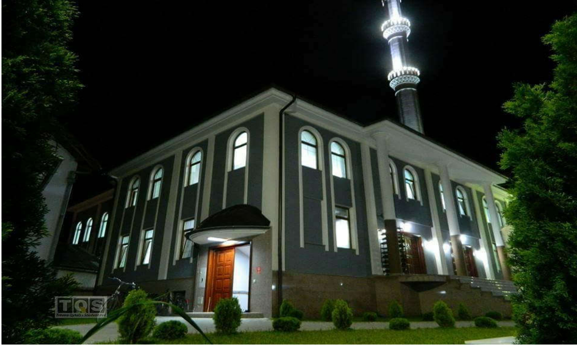
Ek. 4: Eski Camii

Ek. 3: 2013 yılında inřası tamamlanan ve bugün eski Gam GAM Camii'nin yerinde aynı ismi taşıyarak faaliyet gösteren cami binası