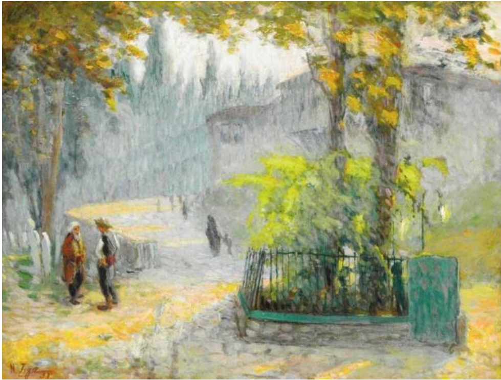
Resim 1: Karacaahmet

Güneş ve hava değişiklikleri Nazmi Ziya resimlerinin başlıca özelliğidir. Rutubetli, nemli hava izlenimini bile tuvale çok büyük bir ustalıkla yansıtabilmiştir. Bu ustalığını özellikle "Karacaahmet" tablosunda görmekteyiz. Bu resimde buğulu hava perdesini delen güneş, ağaçların arasından sızıp, yerde yeşil ve turuncudan oluşan bir yüzey oluşturuyor. Batmak üzere olan akşam güneşinin yumuşak ışıklarından oluşan bir perde doğa üzerine gerilmiş gibidir.