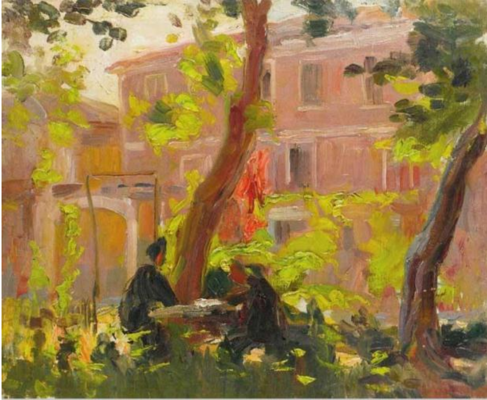
Resim 3: Koç Kahvesi

"Koç Kahvesi"nde ressam üç temel renk kullanmıştır: Pembe, yeşil ve sarı. Masadaki insanlar, arkadaki bina, öndeki sarmaşıklar bu üç rengin tonlarıyla resmedilmiştir.