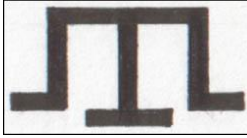
Şekil No:1, Kırım Türklerinin Milli Damgası “üç dişli tarak” motifi

Türk boy ve soyları Orta Asya kökenli olarak bayrak, flama, yapı, mezar taşı ve balballarında kullandıkları motifleri dokumalarında da kullanmışlardır (Selçuk.2007,189). Kırım dokumalarında da genellikle bitkisel ve hayvansal desenler kullanılmakla beraber damgalarda önemli yer tutar. Damgaların çoğu, pek basit çizgilerden ibarettir. İptidai devirlerde bu çizgilerin bir mana ifade edip etmediği bilinmemektedir. Ancak, Kırım'ın kuzey yarısındaki Tatar köylerin her birinde, mezarlıklarda bu damgaları görmek mümkündür.