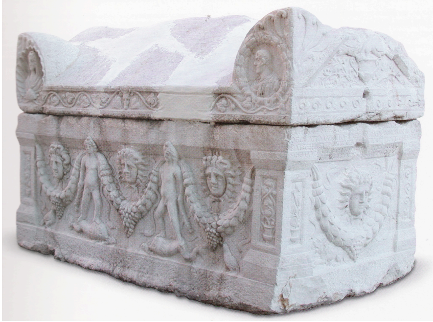
Res.1: Aktarla Lahdi