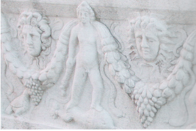
Res.5: Eros ve Medusa figürleri