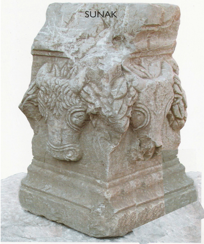
Res.6: Zeus Stratios kutsal alanına ait altar