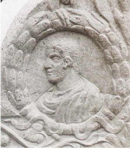
Res.3: Lahdin kapak akroterinde yer alan erkek portresi