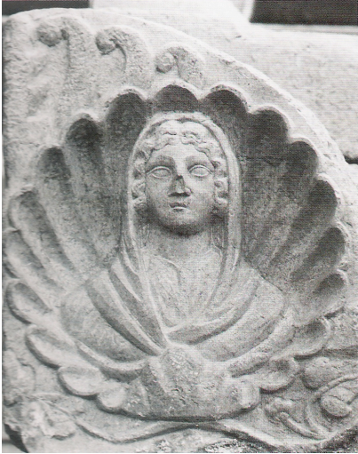
Res.4: Lahdin kapak akroterinde yer alan kadın portresi