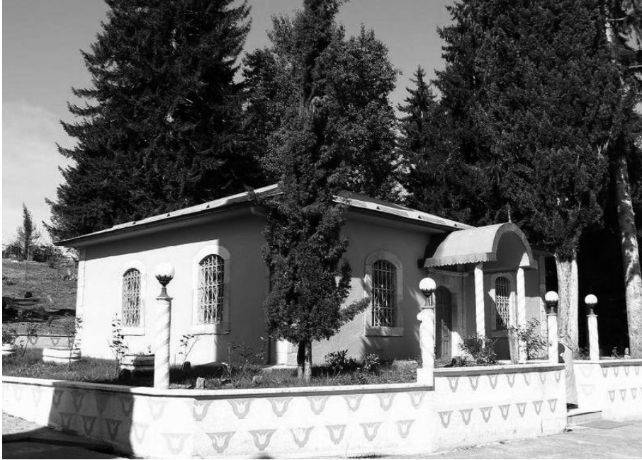
Resim 5: Şeyh Kerameddin Türbesi

Şeyh Kerameddin türbesi, cami, su kuyuları ve mezarlığın da içinde yer aldığı arazi, yaklaşık 25-30 dönüm civarındadır. Cami gibi türbenin de ilk kez kim tarafından nasıl inşa edildiği bilinmiyor. Muhtemelen ahşap olan yapı, Osmanlı'nın son devrinde yıkılarak yığma-kesme taştan inşa edilmiştir. Nitekim vakıf kayıtlarında 1850'li yıllarda türbenin onarımdan geçtiği bilgisine yer verilmiştir. 30