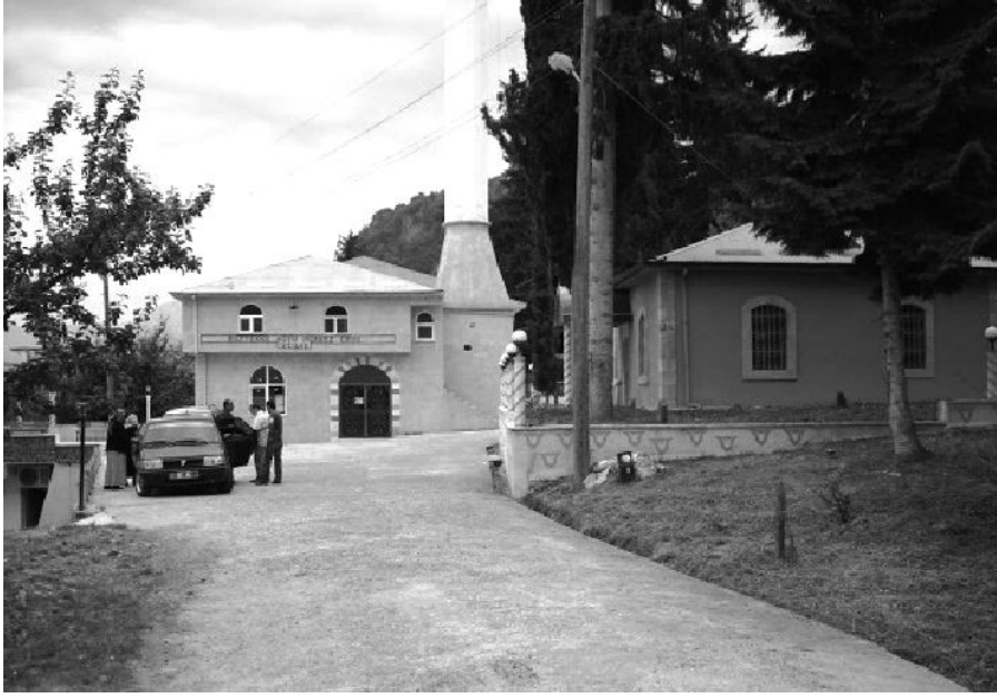
Resim 2: Şeyh Kerameddin Camii ve Türbesi (Merkez / Boztekke Köyü)

etmiştir. Ancak mahkeme gerekli tahkikatı yaptıktan sonra konuyu görüşmüş ve adı geçen şahsı haksız bularak talebini geri çevirmiştir. Bu tarihte Sayaca ve Kızılkaya köylerinde bulunan vakıf yerlerden, zaviyeye yıllık 1000 akçe akar temin edildiği beyan edilmiştir. 14